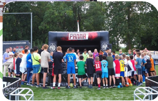
Panna Knock Out toernooi bij R.K.S.V. Altior