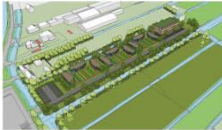
Vogelvlucht gezien vanaf (A)