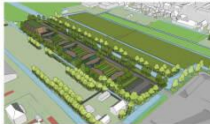
Vogelvlucht gezien vanaf (B)