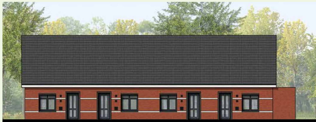
Impressie: Voorgevel seniorenwoningen