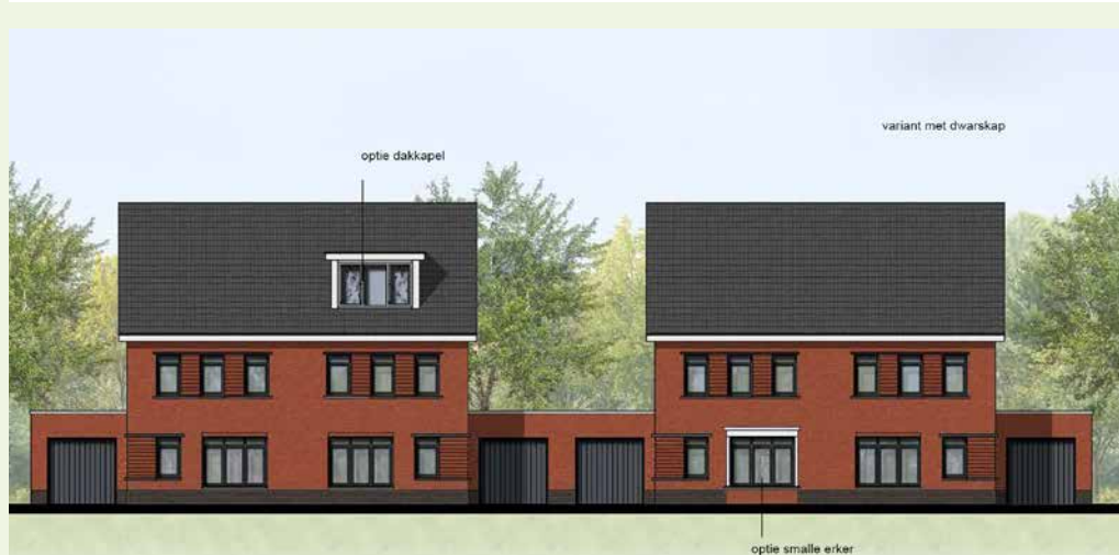
Impressie: Voorgevel tweekappers

Na het verkrijgen van de omgevingsvergunning kan Bolton Bouw starten met de bouw. Naar verwachting is dat in het najaar van 2022.