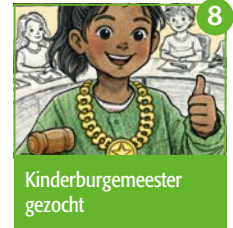
8 Kinderburgemeester gezocht