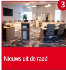
3 Nieuws uit de raad