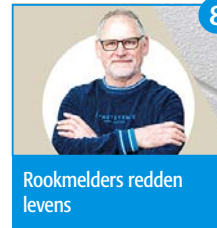
8 Rookmelders redden levens