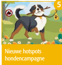
5 Nieuwe hotspots hondencampagne