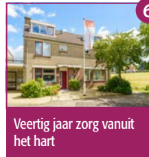
6 Veertig jaar zorg vanuit het hart