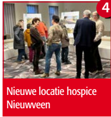
Nieuwe locatie hospice Nieuwveen