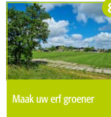
Maak uw erf groener