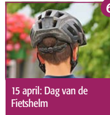
15 april: Dag van de Fietshelm