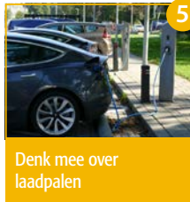
Denk mee over laadpalen