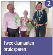
Twee diamanten bruidsparen