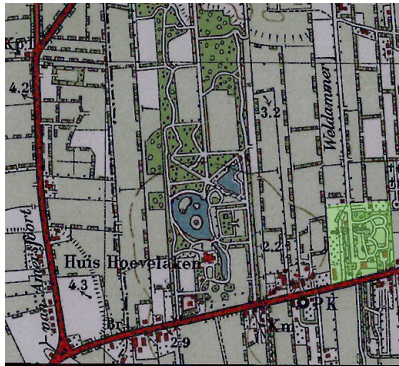
situatie rond 1930

Park Weldam 2 en 4. Het nieuwe huis van de heer Deen is geen lang leven beschoren.