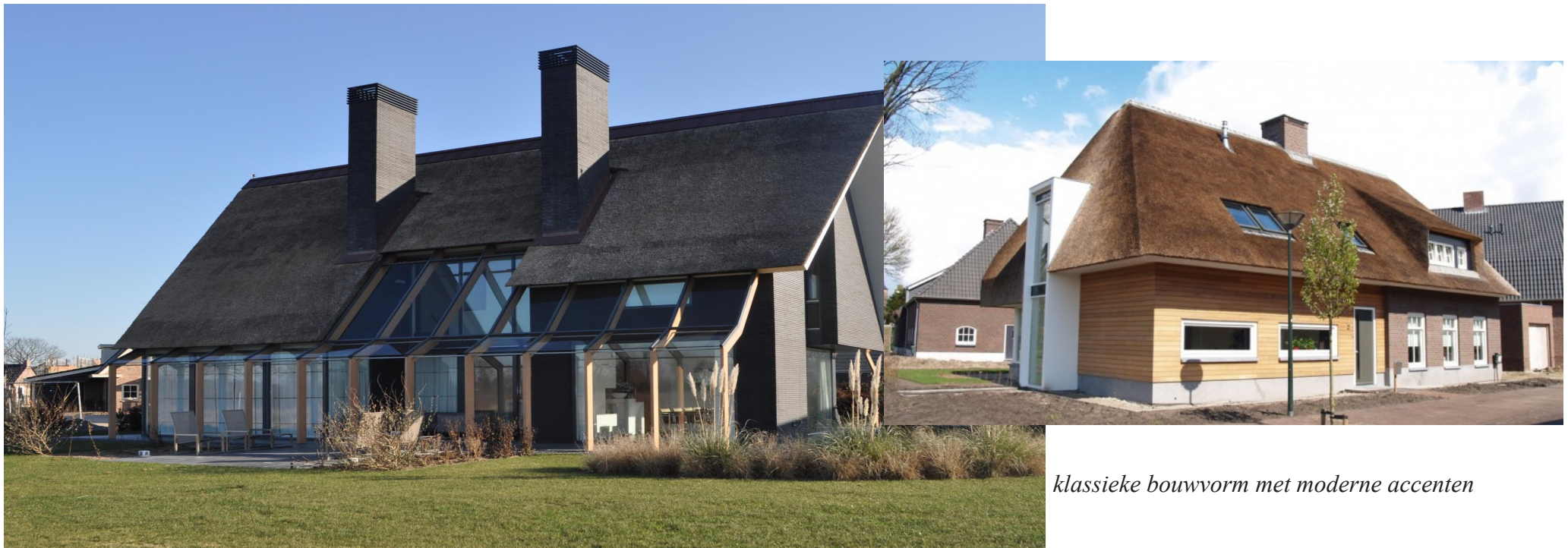
klassieke bouwvorm met moderne accenten