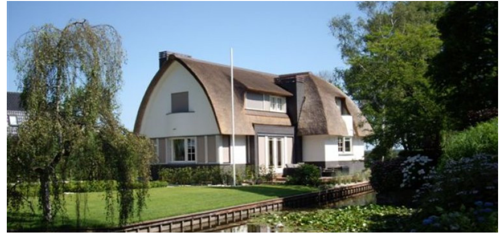
klassieke bouwstijl met rieten of pannendak

De bijgebouwen/ garages die los of aangebouwd worden bij de woningen vormen een eenheid met het hoofdgebouw.