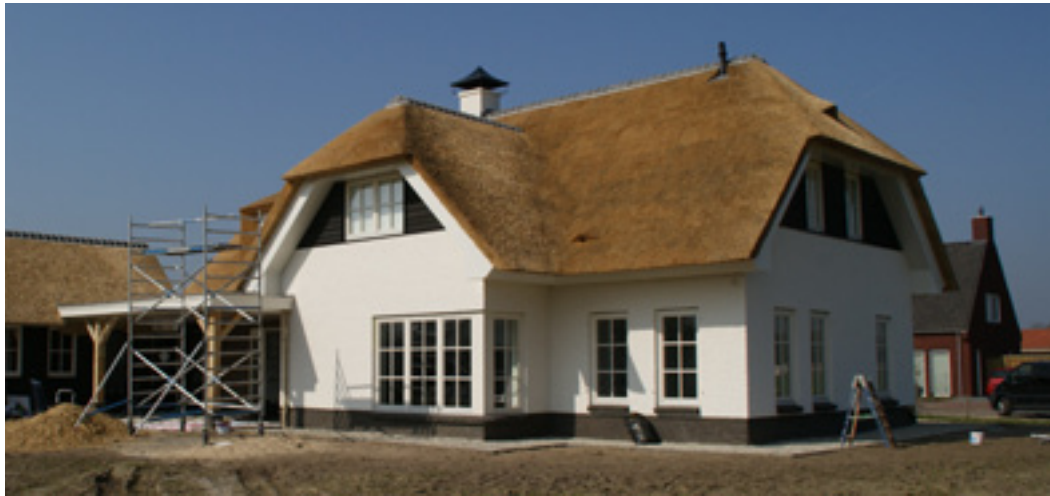
klassieke bouwstijl wit gekeimd of met aardkleuren