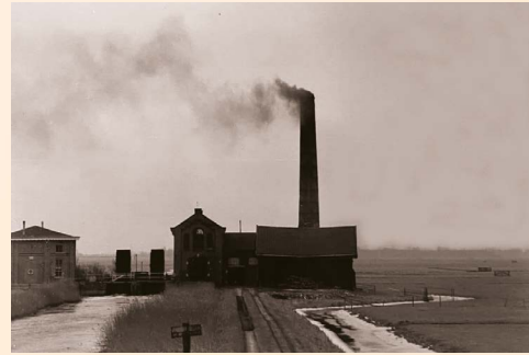
Foto: Zoals het gemaal toen was