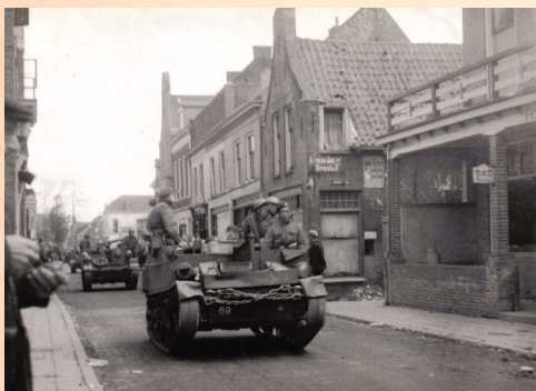
Canadese bevrijders rijden Oosterstraat binnen.

Laten we samen 80 jaar vrijheid herdenken, vieren, koesteren en de boodschap van vrijheid doorgeven aan toekomstige generaties.