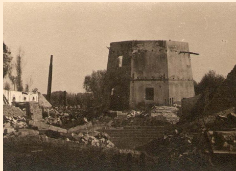
Foto: de restanten van de kapot geschoten molen.

De tentoonstelling is vrij toegankelijk te bezoeken tussen 11.00 en 16.00 uur.