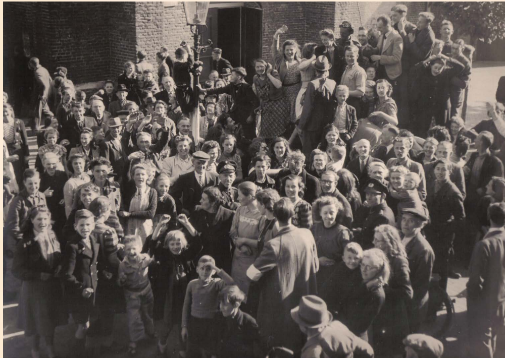
Eindelijk vrij! Feest bij de toren van Nijkerk.

Van september 2024 tot en met augustus 2025 staat Nederland stil bij dit 80-jarig lustrum. Samen met alle betrokken organisaties en gemeenten wil het kabinet er een gedenkwaardige viering van maken. Want vrijheid, democratie en de rechtsstaat zijn niet vanzelfsprekend. Deze moeten we koesteren, uitdragen en beschermen.