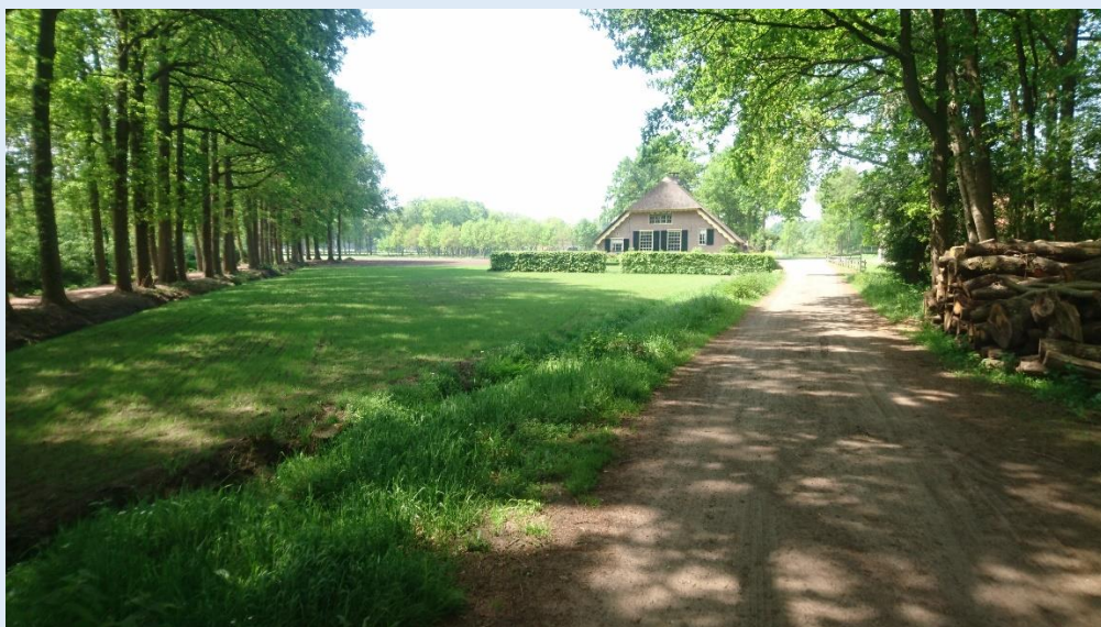
Hoeve de Ahof, Appel