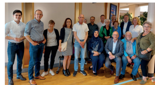
Op 9 juni waren 14 inwoners van de gemeente Gast van de raad.

Na lange tijd ontvingen we weer gasten van de raad. Willekeurig geselecteerde inwoners van de gemeente ontvingen een uitnodiging om een avondje mee te lopen met de gemeenteraad. Een mooie manier om kennis te maken met raadsleden en het werk van de gemeenteraad. Wilt u ook eens gast van de raad zijn? Stuur dan een berichtje naar griffie@nijkerk.eu dan zetten we u op de lijst van genodigden voor de gast van de raad van 6 oktober aanstaande.