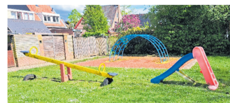
Het glijbaantje in deze speeltuin staat hier illegaal

De illegaal geplaatste speeltoestellen die niet verwijderd zijn, worden in de week van 3 juni 2024 opgeruimd.