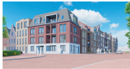
Een impressie van Bouwplan Kerkplein

De gemeente Nijkerk werkt in overleg met allerlei partijen aan de nieuwbouwplannen voor woonzorgcentrum Sint Jozef en het Kerkplein in de binnenstad van Nijkerk. Er is een belangrijke stap gezet voor de ontwikkeling van beide plannen. Het bestemmingsplan voor Het Nieuwe St. Jozef en de nieuwe kaders voor Bouwplan Kerkplein zijn naar de gemeenteraad gestuurd. En dat is goed nieuws, omdat er met die plannen weer flink wat woonruimte in Nijkerk bij komt. Maar eerst neemt de gemeenteraad er een besluit over.