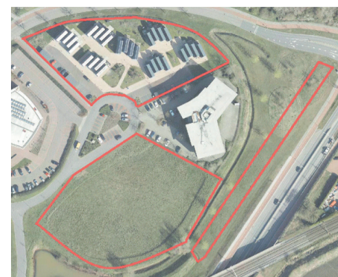
Figuur 1. Plangebied bestemmingsplan Spookkamp 1B Wonen (rood omlijnd)

Burgemeester en wethouders van Nijkerk maken in verband met het bepaalde in artikel 3.8, derde lid van de Wet ruimtelijke ordening bekend dat de raad van de gemeente Nijkerk bij besluit van 19 september 2024 het bestemmingsplan Spookkamp 1B Wonen gewijzigd heeft vastgesteld. Tegen het ontwerpbestemmingsplan zijn drie zienswijzen ingediend en de beantwoording van de zienswijzen heeft tot aanpassing van het bestemmingsplan geleid.