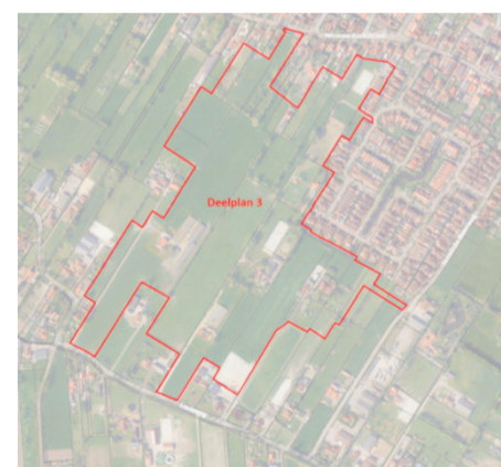
Plangebied woningbouw Nijkerkerveen deelplan 3 (aangegeven door een rode lijn)

Het oorspronkelijke bestemmingsplan maakt de bouw mogelijk van 350 woningen en appartementen. Het plangebied ligt aan de zuidkant van de bebouwde kom van Nijkerkerveen. Het plangebied wordt aan de noordzijde begrensd door de Nieuwe Kerkstraat en de rand van de bestaande kern, aan de oostzijde door de rand van de bestaande kern en een aantal weilanden, aan de zuidzijde door de Laakweg en aan de westzijde door het bestaande kleinschalige agrarische gebied met verspreid liggende bebouwing en groensingels. Op bijgaand kaartje staat de grens van het plangebied aangegeven.