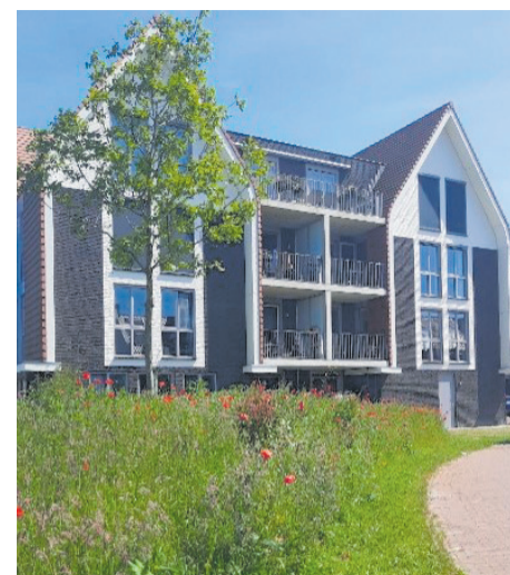
Voorbeeld van ecologische berm in woonwijk Doornsteeg

Doet u ook mee aan Maai Mei Niet? Als u het gras slechts om de vier weken maait, komen er al tot tien keer meer bijen in de tuin.