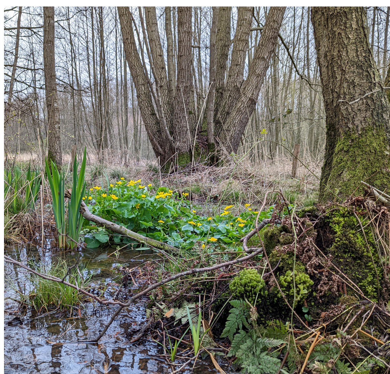
NAT ESSEN- VOGELKERSBOS