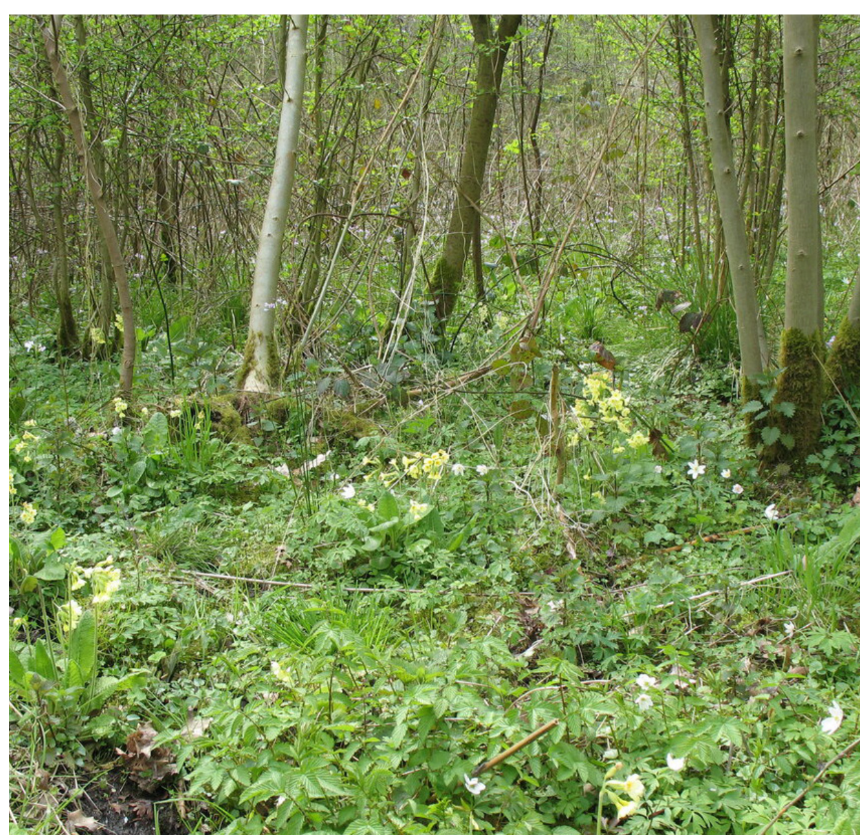
NAT-VOCHTIG ESSEN- VOGELKERSBOS