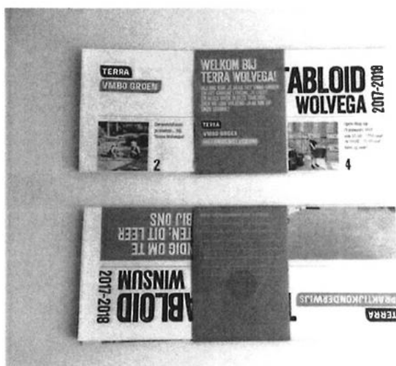
Voorbeeld van hoe je een krant net even anders kunt aanbieden

Dit alles vraagt om een zogenoemde bladformule, een compacte, toepasbare leidraad voor de krant. De formule omschrijft de DNA van de krant (waarden), welke thema's erin voorkomen (pijlers) en welke inhoud daarbij hoort (rubrieken). Met de formule in de hand, weet iedereen wat we gaan maken en 'is de toon gezet'. Niet alleen voor deze verkiezingen, maar juist ook houvast voor de lange termijn.