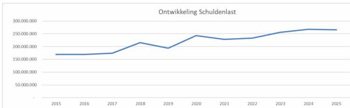
Grafiek: Ontwikkeling schuldenlast 2022

De liquiditeitsprognose voor de jaren na 2022 laat zien dat er opnieuw extra externe middelen via leningen nodig zijn. In 2023 komt het schuldenplafond daardoor boven de € 250 miljoen uit, waardoor het vastgestelde kader moet worden verhoogd naar € 300 miljoen. Na de piek van 2024 zien we een dalende trend.