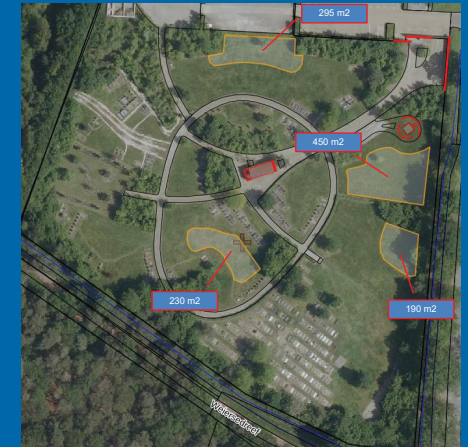
De gele vlekken geven aan waar het bloemen mengsel ingezaaid is.

De werkgroep heeft daarom op basis van input van bezoekers en de opgedane ervaringen besloten het maaibeleid aan te passen.