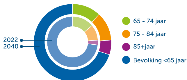
Huishoudenssamenstelling 2022 - 2040