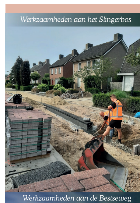
Werkzaamheden aan het Slingerbos