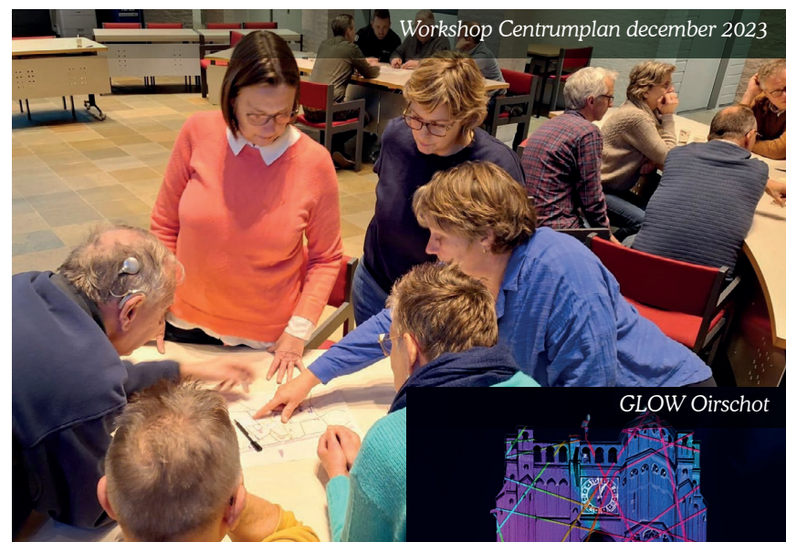
Workshop Centrumplan december 2023