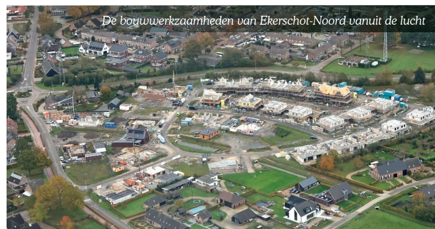
De bouwwerkzaamheden van Ekerschot-Noord vanuit de lucht