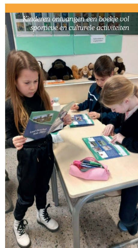
Kinderen ontvangen een boekje vol sportieve en culturele activiteiten