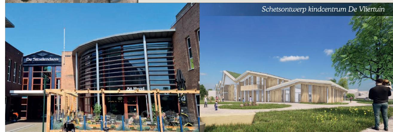
Schetsontwerp kindercentrum De Vliertuin