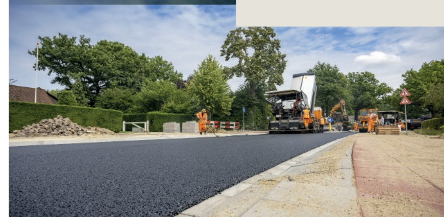
Werkzaamheden aan de Bestseweg