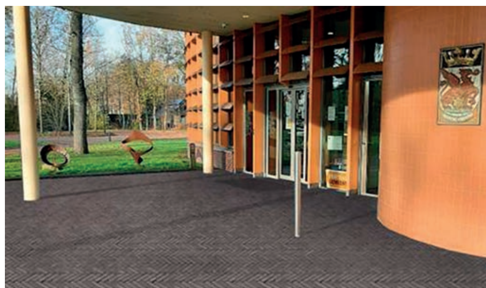
Impressie entree gemeentehuis

Tussen 10 en 17 juni krijgt het plateau bij de entree van het gemeentehuis nieuwe bestrating. Dit kan enige hinder geven voor bezoekers. Als u hulp nodig heeft om binnen te komen, helpen de stratenmakers u graag.