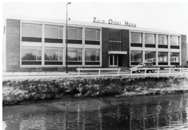
Zuivelfabriek Zuid-Oost-Hoek in 1970