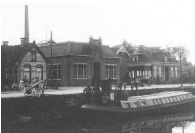
Zuivelfabriek Zuid-Oost-Hoek in de jaren '20 van de vorige eeuw

In de paragraaf Plangebied worden de locatie, haar ontstaansgeschiedenis en de omgeving beschreven. Vervolgens wordt ingegaan op de stedenbouwkundige visie, de openbare ruimte en worden de bebouwingsvoorschriften uitéén gezet. Per thema is aangegeven welke regels er gelden. Dit gaat zowel over de bebouwing als over de relatie openbaar-privé. Tot slot wordt ingegaan op het vervolgproces ten aanzien van de bouwplanbegeleiding.