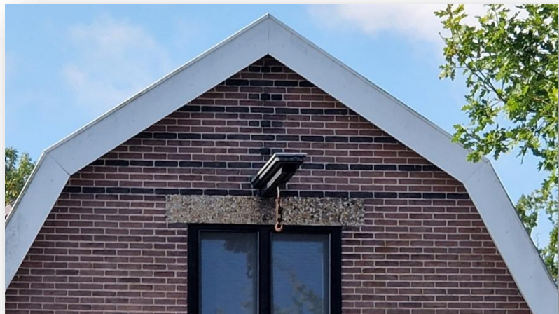
Foto 6 Vaart Zuidzijde 57 te Appelscha

Naast en boven de hijsbalk zijn speklagen van donkere geglazuurde steen aangebracht. Met precies midden boven de hijsbalk tussen de speklagen drie geglazuurde kopse stenen. Een klein detail wat gemakkelijk over het hoofd gezien wordt.