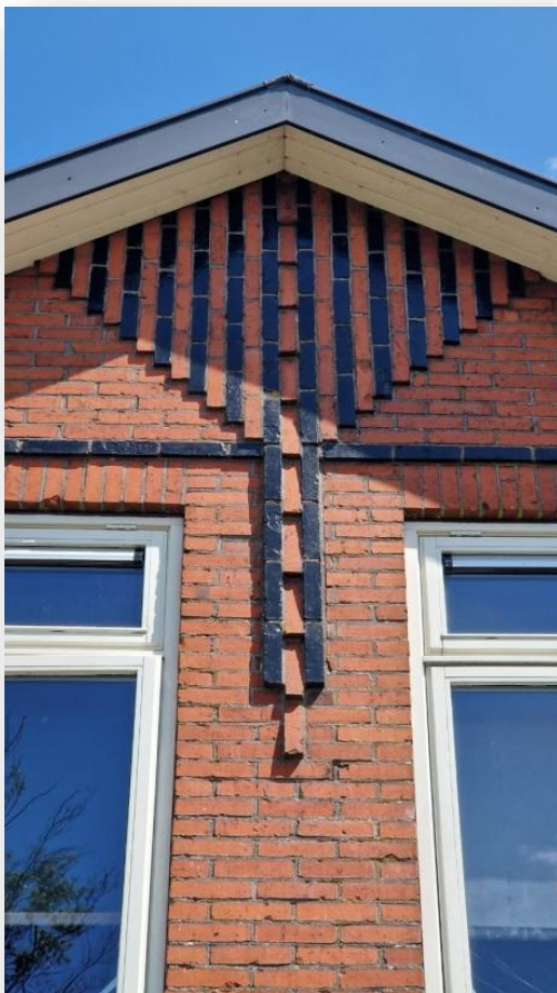
Foto 8 Vaart WZ 12 te Donkerbroek

Verticale versiering in een topgevel onder een mansardekap. Het siermetselwerk iets uitstekend en afwisselend aangebracht met geglazuurde stenen. In het midden schuin uitstekende stenen.