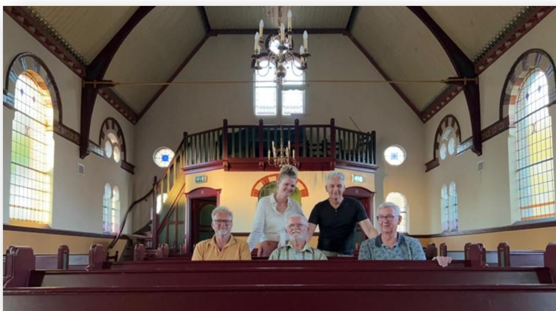
De monumentenambassadeurs van de Gemeente Ooststellingwerf in de dorpskerk van Elsloo