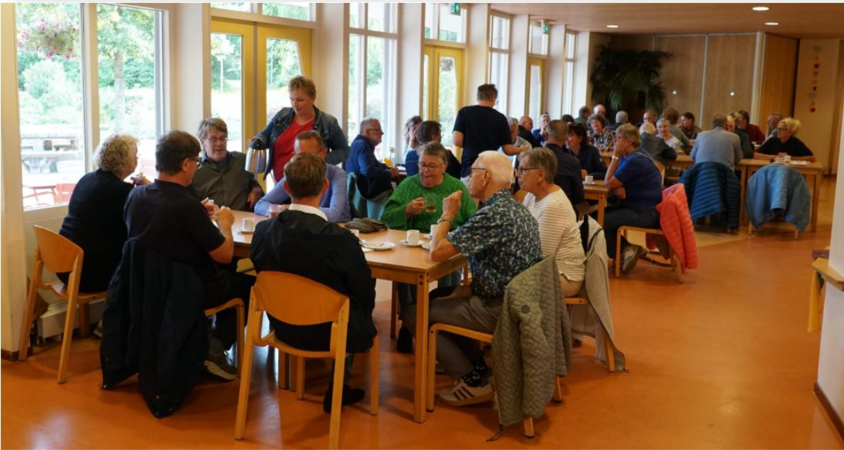
Koffie, thee en gebak tijdens de tussenstop bij Olmen Es