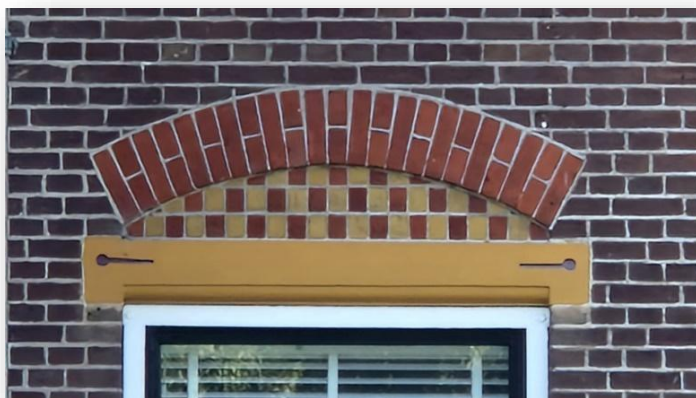
Foto 3 Verticaal metselwerk ter accentuering van de bouwdatum van het röntgengebouw

Naast de fraaie blokvorm onder de gekleurde gebogen rollaag is ook de betonlatei met zijn versiering bijzonder.