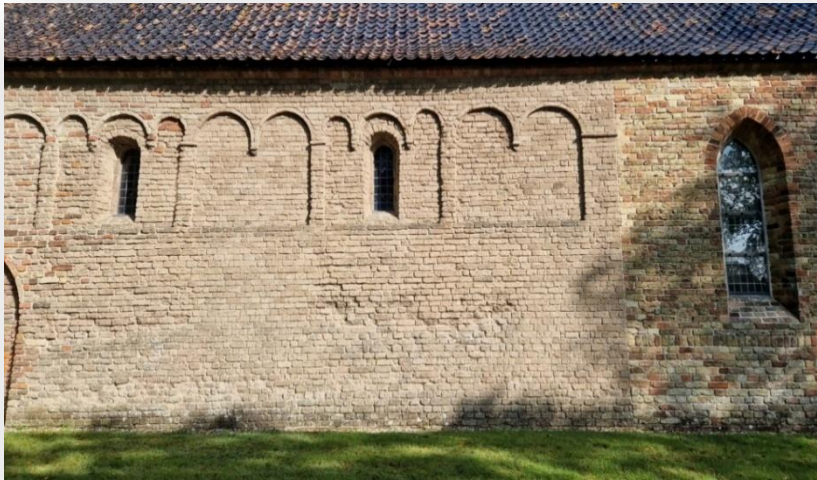
Foto 1 Boogfriezen in de muur van de Bonifatiuskerk te Oldeberkoop

Veelal is de functie decoratief en soms in combinatie met functioneel metselwerk. Een mooi voorbeeld hiervan staat hieronder afgebeeld (foto 1). Het betreft de Bonifatiuskerk te Oldeberkoop. De boogjes die te zien zijn noemen we boogfriezen. Deze bevinden zich boven zogenaamde spaarvelden. Dit is naar binnen liggend metselwerk bedoeld om materiaal te besparen op plaatsen waar de stevigheid van het metselwerk minder noodzakelijk is. Dat men al in de vroege bouwperiode deze versieringen toepaste is op deze foto goed te zien. Het muurgedeelte is gemetseld van tufsteen en is waarschijnlijk in de 10e of 11e eeuw al gemetseld. Dergelijke friezen komen in meerdere vormen voor. Zie ook foto 2.