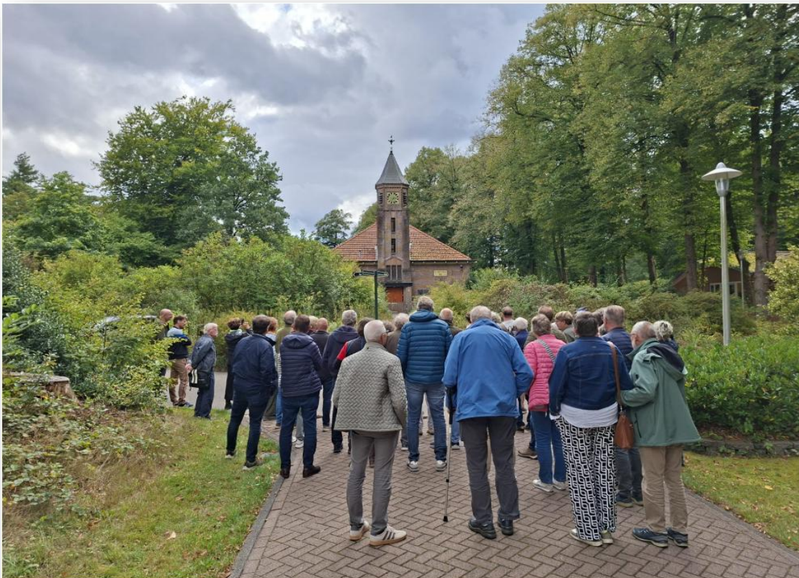
Bezichtiging van het Voormalige Sanatorium bij Olmen Es te Appelscha