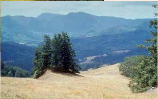
Voor (links) en na (rechts) het uitzetten van de Jacobskruidavdlo tussen uitheemse Jacobskruidplanten in de staat Oregon, USA.