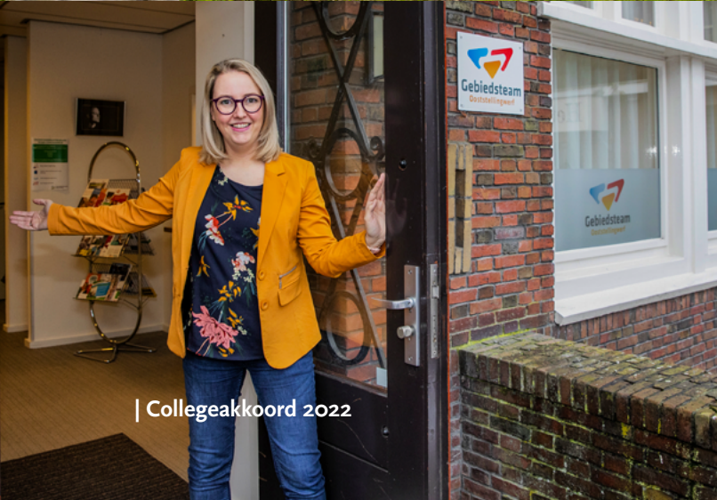
| Colleagueakkoord 2022