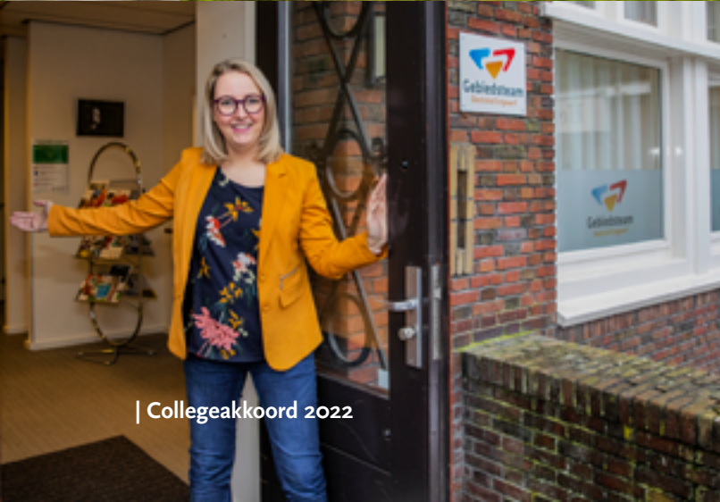
| Colleegeakkoord 2022