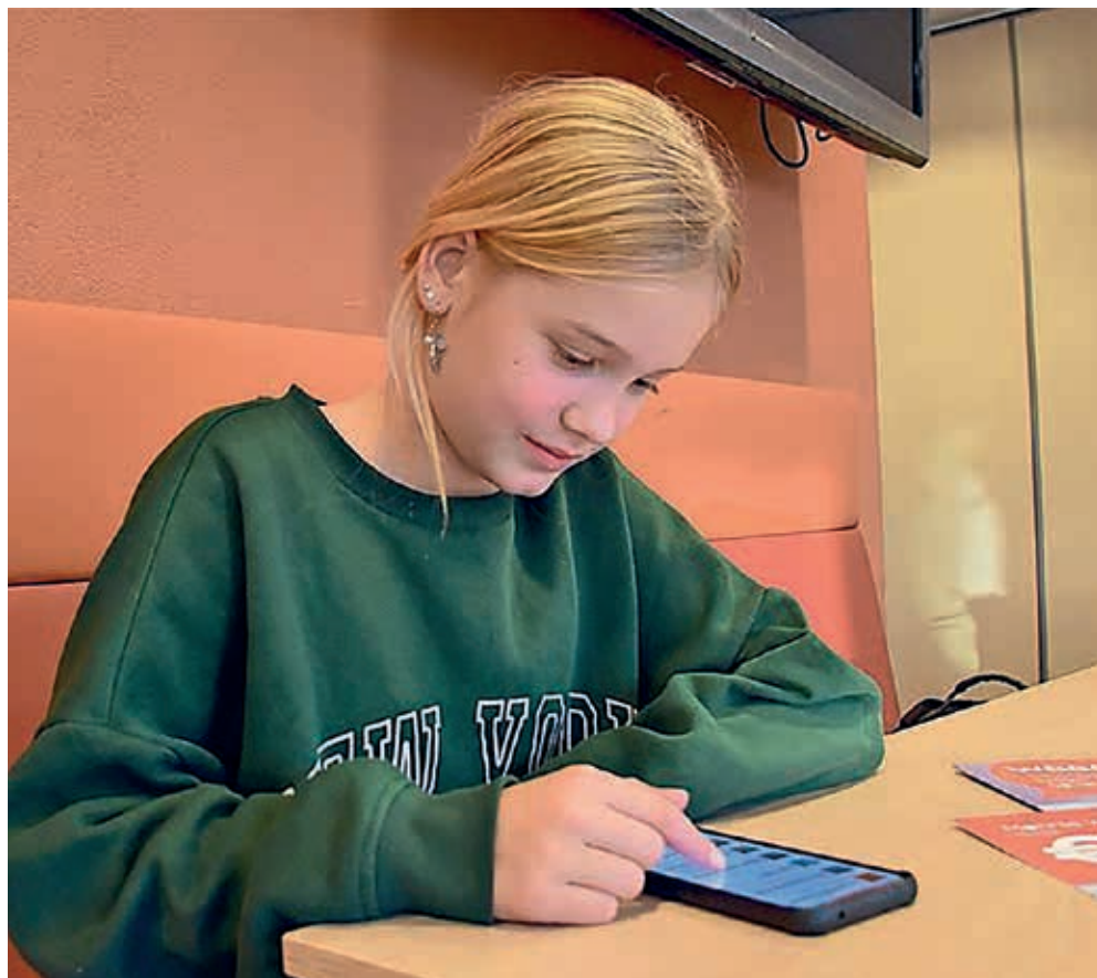
Fayen kijkt in de app of er een activiteit tussen zit die haar aanpreekt.