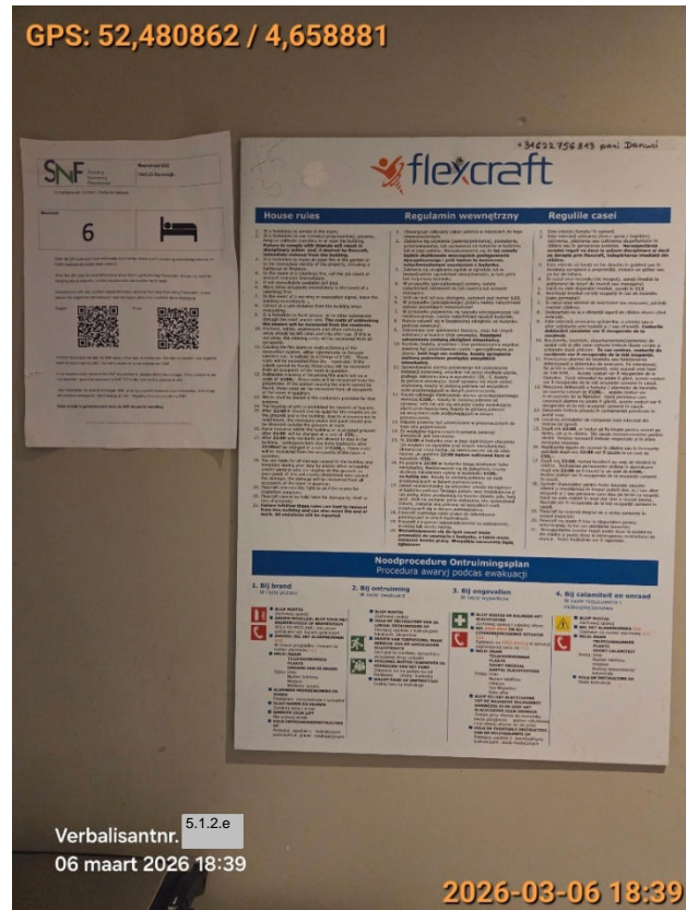
Bijlage 5 - Huisregels