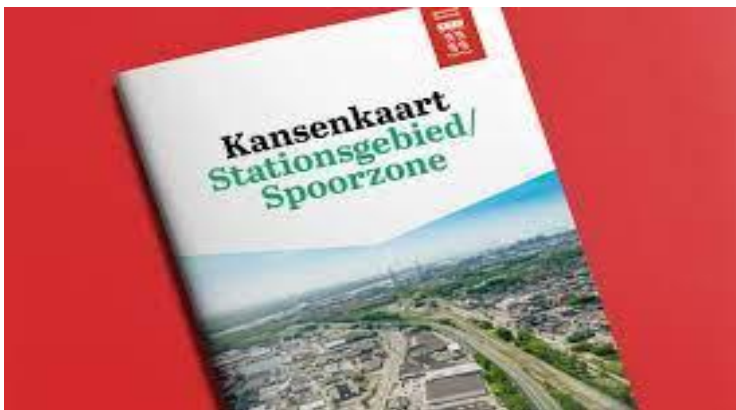
Resultaat uit participatie: kansenkaart stationsgebied-spoorzone