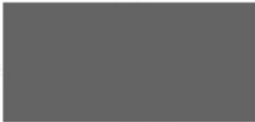
Commissaris van de Koning

Met vriendelijke groet, Gedeputeerde Staten van Gelderland