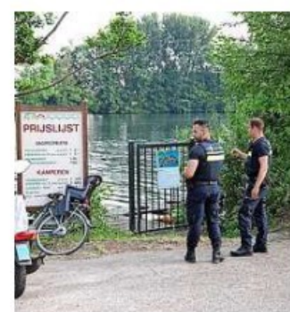
Hoe het fatale ongeval kon gebeuren, is nog niet duidelijk.