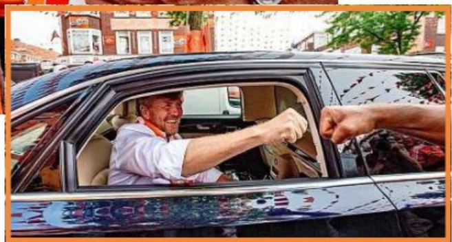
Deze 'boks' was dan weer wel coronaproof!

afstraalde op de rest van het gezin. Op het paleis, waar vorig jaar haar vader nog excuses maakte voor het beschamen van het vertrouwen van de burgers, leek men inderdaad niet doof voor gevoelens in de samenleving.