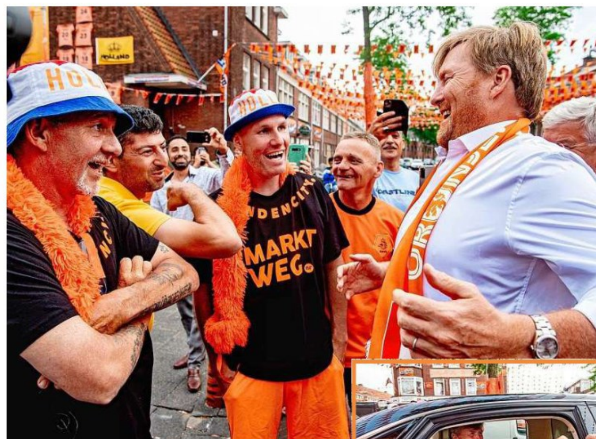
Koning Willem-Alexander had het zichtbaar naar zijn zin bij zijn onaangekondigde bezoek aan de Haagse Marktweg. Daarbij vergat hij in zijn enthousiasme soms echter de coronaregels.

Nu oogste ze geen hoon, maar sympathie, die handig