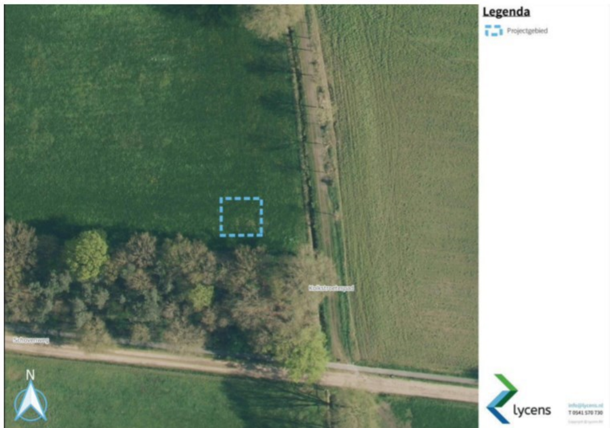
Figuur 1.2: Ligging projectlocatie

De projectlocatie ligt aan de Schovenweg, aan het Kolkstroeterpad en staat kadastraal bekend als (kadastrale) gemeente Zelhem, sectie W, nummers 322. In figuur 1.2 wordt de ligging van de projectlocatie weergegeven.