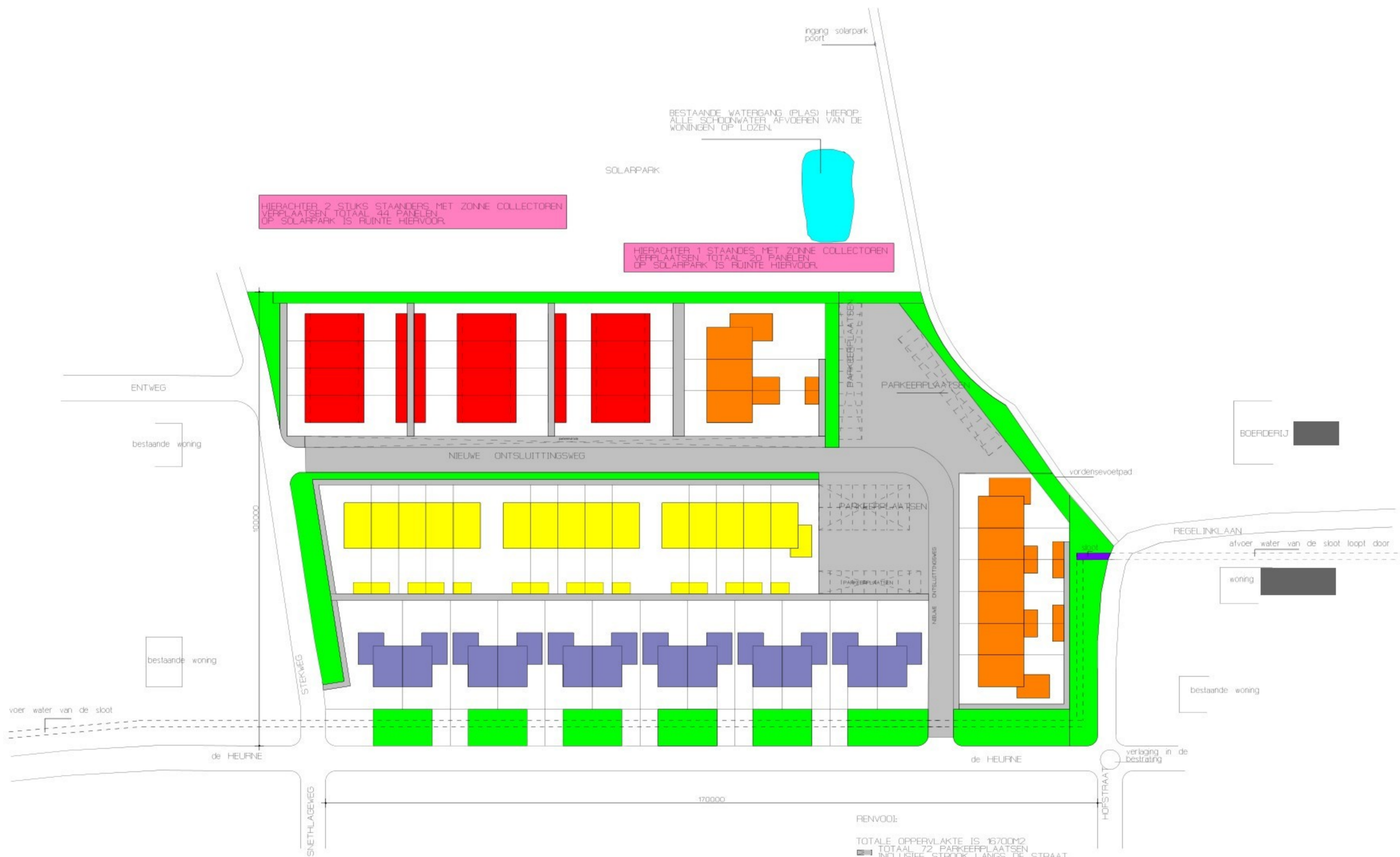
SITUATIE TEKENING LANGS DE HEURNE