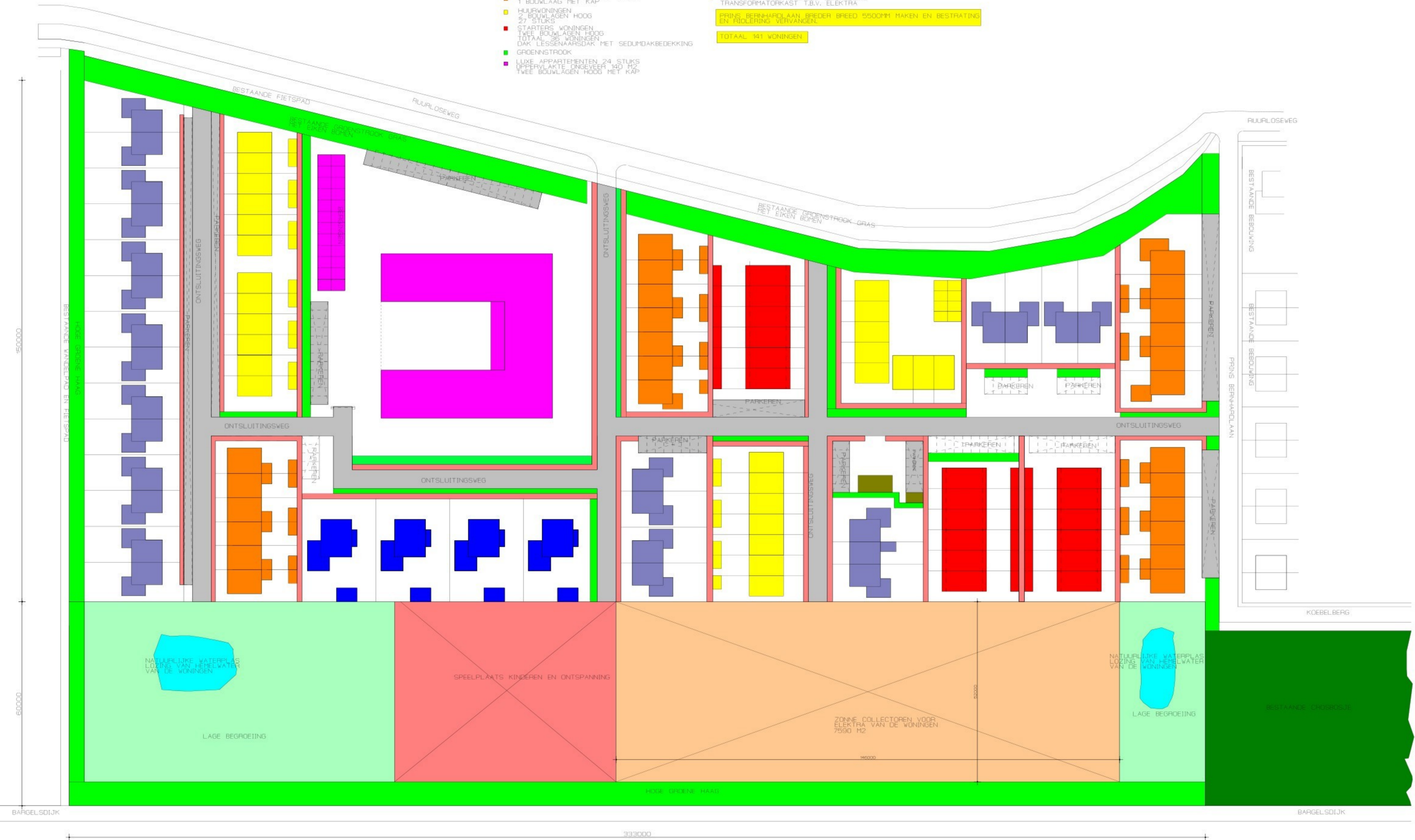
SITUATIE TEKENING PRINS BERNHARDLAAN / RUURLOSEVEG