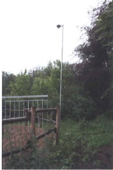
Figuur 3 Lichtmasten rond de stapmolen