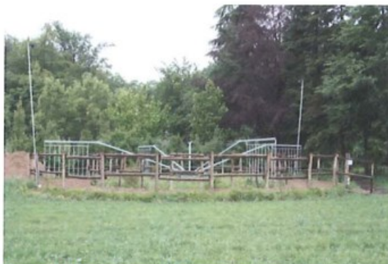
Figuur 1; Huidige situatie stapmolen vanuit de noordzijde (eigen terrein)