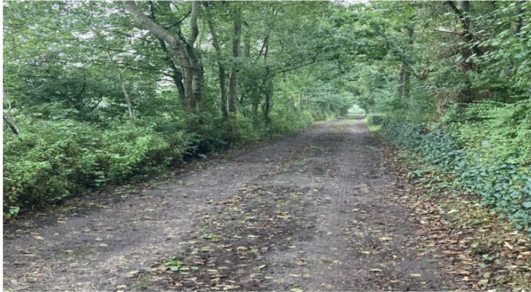
Foto 13: Foto van de andere weg. Dit is volgens de gemeente geen openbare weg. Aan de linkerkant is het Homear en aan de rechterkant de Wopkeloane.

Foto 12 : foto van de Tweede Mellereed (wegnr: 900012). Dit pad is exact hetzelfde als de Mellereed. De gemeente stelt echter dat de Mellereed geen beperking kent, maar de tweede Mellereed wel. De tweede Mellereed is volgens de gemeente een voetpad.