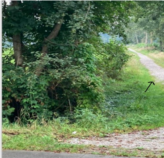
Foto 4: het pad tussen de Pauloane 54 en de Wopkeloane 2. Dit deel is 2.40 meter breed

Foto 3: situatie vanaf de Feartswal. Dit schelpenpad is begin 2023 door de gemeente aangelegd. Daarvoor was het niet dan wel nauwelijks voor fietsers/voetgangers toegankelijk. Er was enkel een smal, modderig, spoor zichtbaar met aan weerskanten hoog gras.