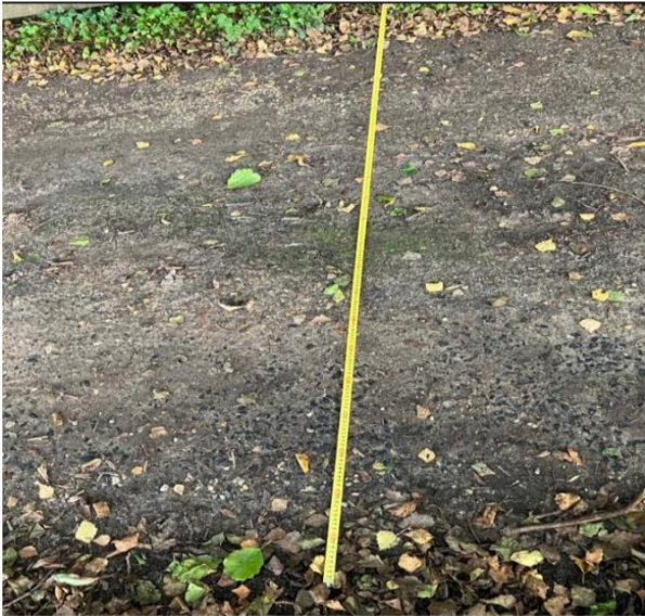
Foto 5: het pad naast de Mellereed 2. Dit deel is 2.15 meter breed

Foto 4: het pad tussen de Pauloane 54 en de Wopkeloane 2. Dit deel is 2.40 meter breed