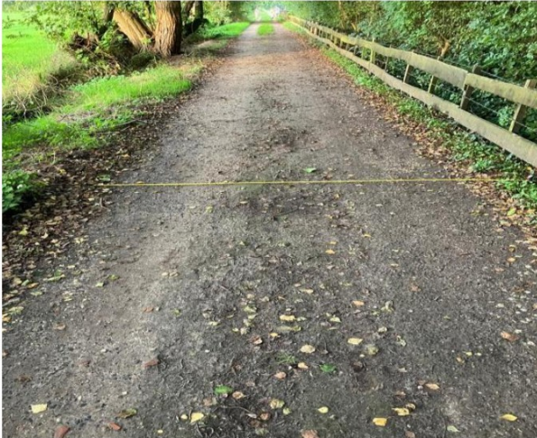
Foto 7: het in het begin van 2023 door de gemeente aangelegde schelpenpad. Dit pad is 1.20 meter breed.