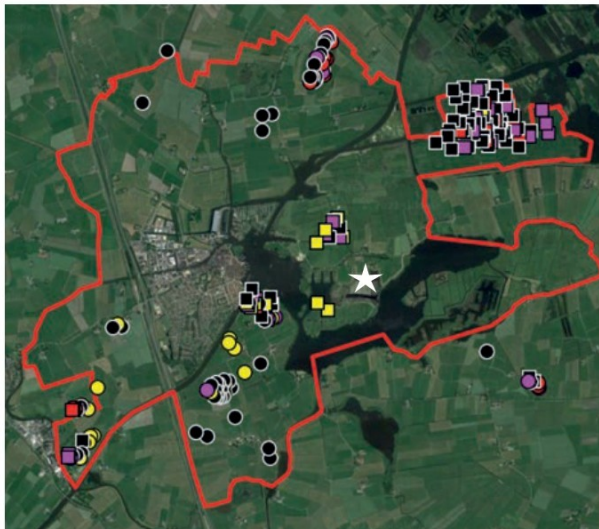
Figuur 4. Resultaten weidevogels 2017 t.o.v. het plangebied (witte ster).