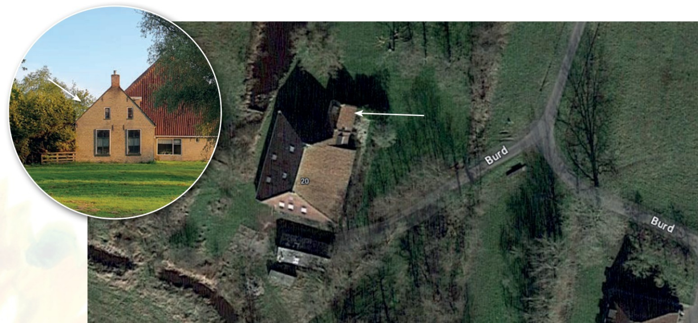
Figuur 5. Locatie van aangetroffen paarverblijfplaats gewone dwergvleermuis (witte pijl). Inzet: noordzijde woongedeelte boerderij.

Rond 20.30 uur zijn twee gewone dwergvleermuizen foeragerend te zien en te horen aan de zuidwestzijde van de boerderij, waarbij soms een rondje om de boerderij wordt gemaakt welke mogelijk opnieuw wijst op binding met de woonboerderij. Gedurende de avond worden met enige regelmaat overvliegende en foeragerende gewone- en ruige dwergvleermuizen opgepikt en eenmaal een laatvlieger en een meervleermuis overvliegend (oostzijde). Eenmaal wordt een ruige dwergvleermuis opgepikt met een sociale roep in vlucht. Rond 22.00 uur wordt een sociale roep van een gewone dwergvleermuis ter plaatse opgepikt met de batdetector, aan de oostzijde van de boerderij. Het geluid was het luidst te horen aan de noordoostzijde van het woongedeelte waar dak pannen op houten dakbeschot liggen. De gewone dwergvleermuis was voortdurend roepend te horen vanuit zijn paarverblijfplaats tot vertrek naar de veerpont om 23.00 uur (figuur 5).