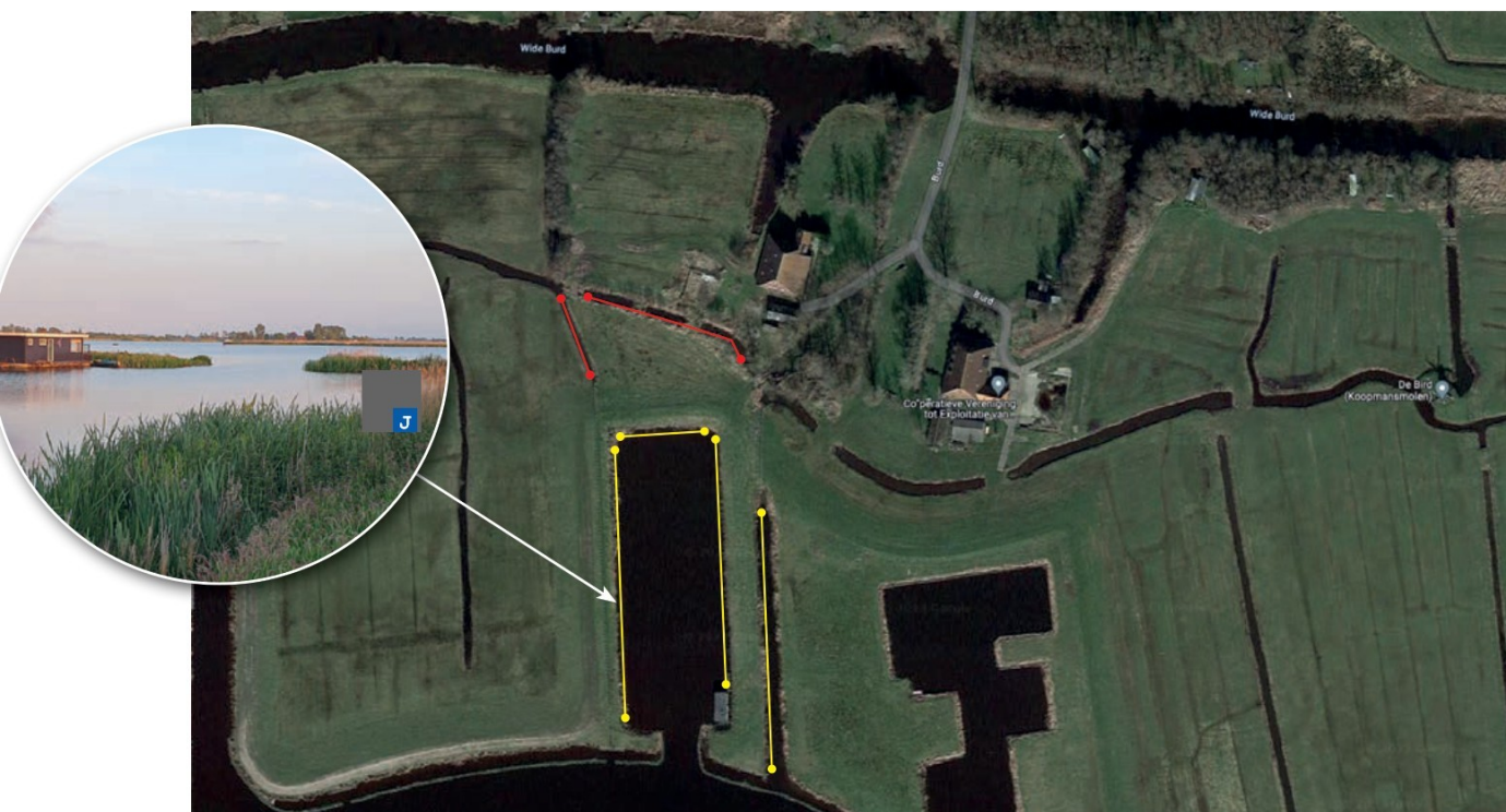
Figuur 3. Trajecten waar de monsters zijn genomen om de aanwezigheid van de waterspitsmuis inzichtelijk te krijgen. Monster 1 - gele lijnen. Monster 2 - rode lijnen.

Om de aanwezigheid van de waterspitsmuis vast te stellen is eDNA-onderzoek uitgevoerd. Met het onderzoek kan, bij negatieve resultaten (oftewel de soort is niet aangetroffen), niet worden geconcludeerd dat de soort niet in het gebied voorkomt. Daarom is deze methodiek enkel voor het vaststellen van de soort relevant. Bij het niet aantreffen van de soort, is nader onderzoek met inloopvallen vereist. In totaal zijn er twee monsters met elk 15 samples genomen binnen het gebied die vooraf als mogelijk geschikt leefgebied van de waterspitsmuis zijn geacht (figuur 3).