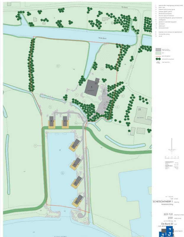
Figuur 2. Schetsontwerp van het planvoornemen. Bron André van Dijk Architect