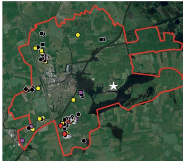
Figuur 5. Resultaten weidevogels 2021 t.o.v. het plangebied (witte ster).