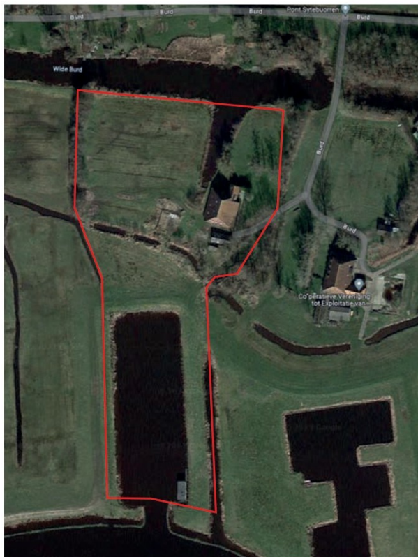
Figuur 1. Locatie van het plangebied (rode lijn).