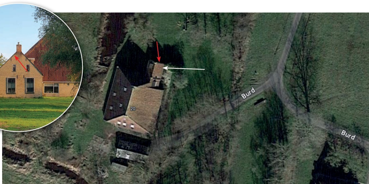
Figuur 3. Locatie van aangetroffen zomerverblijfplaats laatvlieger (rode pijl) en paarverblijfplaats gewone dwergvleermuis (witte pijl). Inzet: noordzijde woongedeelte boerderij.

Op basis van de resultaten van het nader onderzoek wordt geconcludeerd dat er naar alle waarschijnlijkheid ten minste één zomerverblijfplaats van de laatvlieger en één paarverblijfplaats van de gewone dwergvleermuis is aangetroffen in het woongedeelte van de boerderij. Dit deel van het plangebied blijft onaangetast in het planvoornemen. Het planvoornemen leidt niet tot een overtreding van de Wet natuurbescherming voor wat betreft zomer-, paar-, kraam- en (massa)winterverblijfplaatsen van vleermuissoorten mits de verstoring blijft beperkt tot het schuurgedeelte. Als aantasting van het woongedeelte niet kan worden gegarandeerd dient er ontheffing te worden aangevraagd.