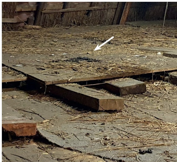
Figuur 8 Latrine steenmarter, 2e verdieping.