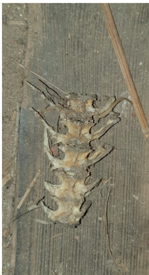
Figuur 6 en 7. Prooirestanten van steenmarter, 1e verdieping.

Tijdens veldbezoek 4 (25 augustus 2023) werd regelmatig activiteit/gestommel van steenmarters gehoord in de boerderij. Later op de avond werden krijsende geluiden van onder het dak gehoord aan de oostzijde. Tijdens Veldbezoek 5 (13 september 2023) is de binnenzijde van het schuurgedeelte gecheckt op sporen van aanwezigheid van de steenmarter. Op de eerste verdieping werden prooiresten aangetroffen in de vorm van o.a. visgraten en lege eierdoppen. Op de tweede verdieping werd een flinke latrine aangetroffen van steenmarters (figuur 6 tm 8).