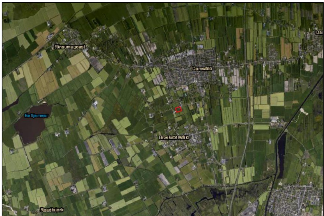
Afbeelding 1.1. Globale ligging van het plangebied (rood kader).

Het plangebied is gelegen aan de Willemstrjitte 27 in Damwâld. Damwâld ligt ten zuiden van Dokkum en ten noordoosten van Leeuwarden. Het plangebied is gelegen buiten de bebouwde kom van Damwâld aan de rand van het dorp. De omgeving van het plangebied bestaat uit agrarische percelen, woningen, wegen, watergangen en bosgebieden. De globale ligging van het plangebied is weergegeven in afbeelding 1.1.