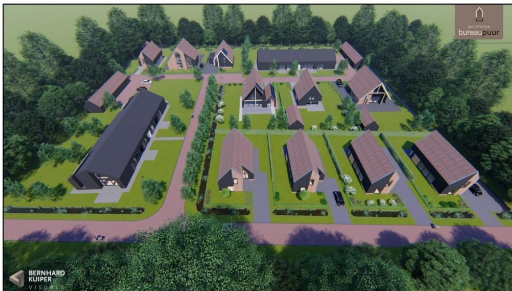
Afbeelding 2.13. visuele weergave van de geplande inrichting van het plangebied.

De opdrachtgever is voornemens om de aanwezige bebouwing en begroeiing te verwijderen en hier op termijn 10 woonhuizen en een schuur te realiseren. Er worden hierbij vier nieuw toegangen op het plangebied gemaakt aan de noordzijde, waarbij enkel de watergang wordt aangetast (afbeelding 2.13). Voor de uitvoering van de werkzaamheden is nog geen datum bekend.