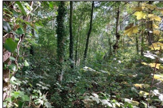
Afbeelding 2.9. Bosgebied.