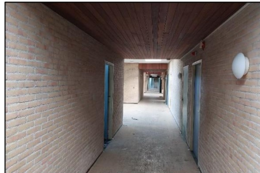
Afbeelding 2.3. Binnenzijde pand.