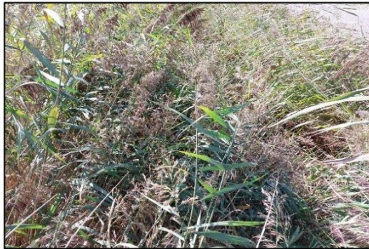
Afbeelding 2.12. Watergang voorzijde plangebied.