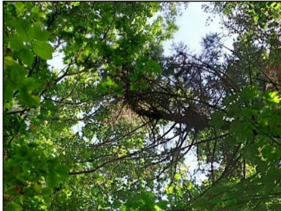
Figuur 3.1. boom met mogelijk jaarrond beschermd nest.

Consequenties van de ingreep op jaarrond beschermde nesten van ransuil en boomvalk staan beschreven in paragraaf 4.2.