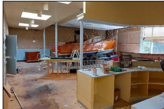
Afbeelding 2.5. Ruimte met bootopslag.