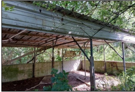
Afbeelding 2.10. één van de bijgebouwen.