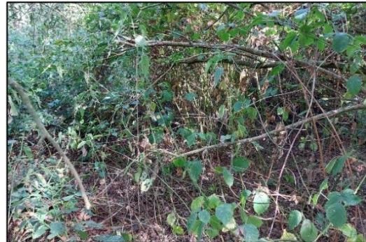
Afbeelding 2.7. Begroeiing achter pand.