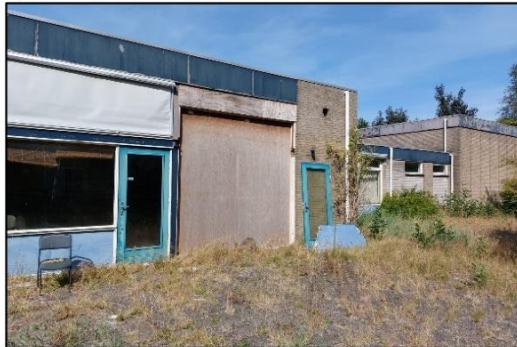
Afbeelding 2.6. Achterzijde pand.