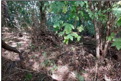
Afbeelding 2.8. Takkenhopen.