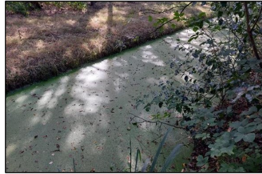
Afbeelding 2.11. Watergang achterzijde plangebied.