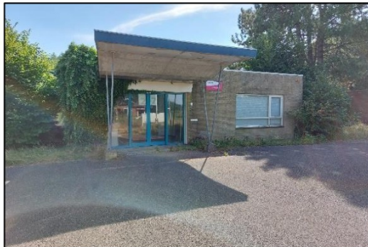
Afbeelding 2.2. Voorzijde pand.