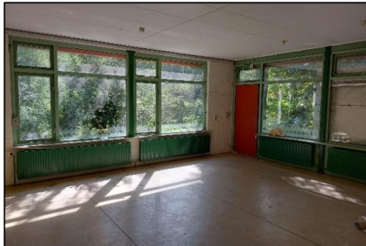
Afbeelding 2.4. Leegstaande ruimte in pand.