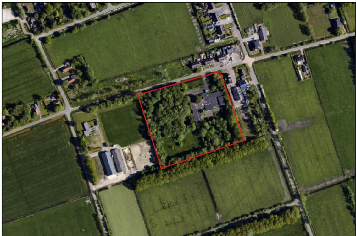
Afbeelding 2.1. Begrenzing van het plangebied (rood kader).

Aan de achterzijde van het pand is de begroeiing meer open. Ondanks de langdurige droogte, toont de aanwezige pitrus dat de bodem hier vochtig is. In de nabijheid van de bebouwing zijn nog enkele losstaande bomen aanwezig.