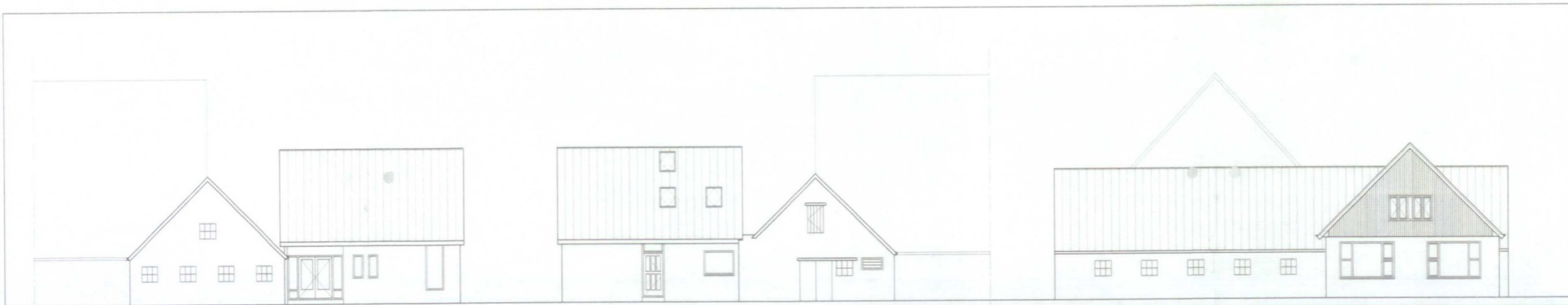
zijgevel links bestaand