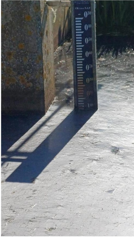
Gemaalpeil 14 mei 2024. Ca. -1.00 NAP