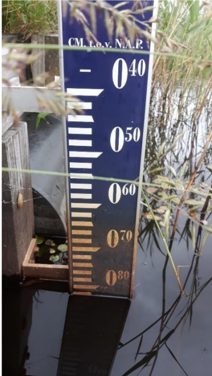
peil stuwbak Sefonsterpolder 31 mei 2024. Peil ca. -0.82 NAP.

Stuw 5 cm lager gezet ivm nattigheid in het land en wens om te maaien volgende week (droog weer voorspelt).