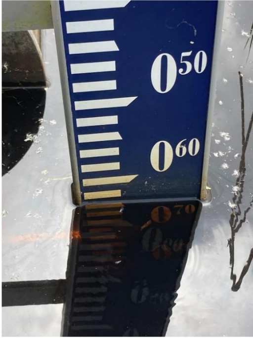
Peil stuwbak Sefonsterpolder 10 mei 2024. -0,63 NAP.

Ca. 20 cm lager gezet ivm geplande maaierwerkzaamheden. Water liep zelfs beetje over pad aan Bijsterboschzijde.