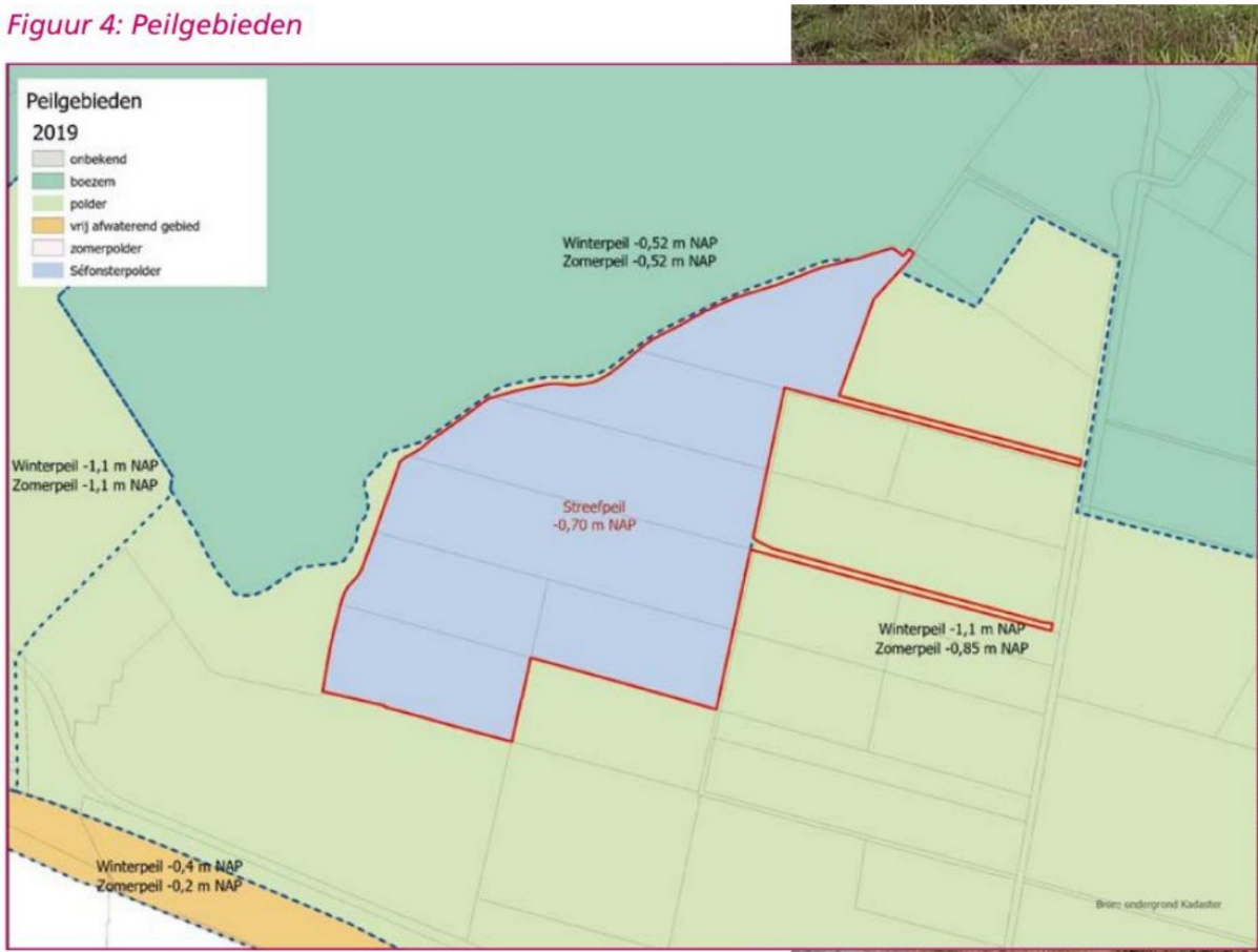
Figuur 4: Peilgebieden

Peil polder winterpeil -1,10 NAP, zomerpeil -0,85 NAP