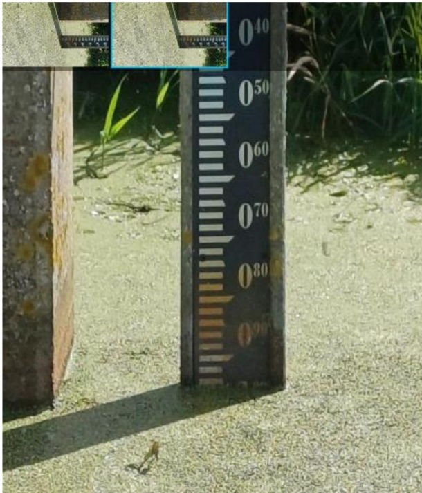
Gemaalpeil 31 juli 2024 ca. -0,95 NAP