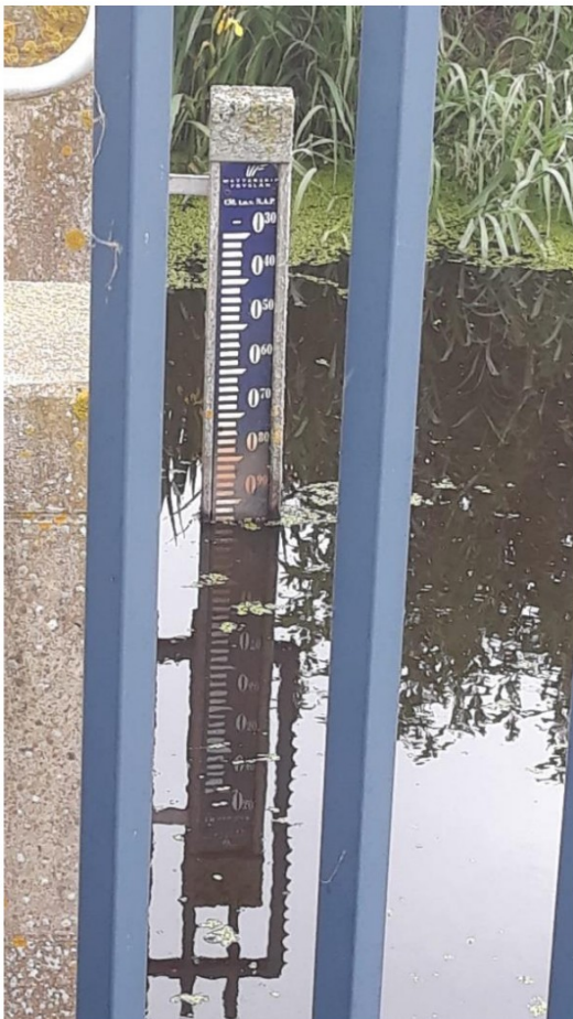
Gemaalpeil 31 mei 2024. Ca. -0.95 NAP

Stuw 5 cm lager gezet ivm nattigheid in het land en wens om te maaien volgende week (droog weer voorspelt).