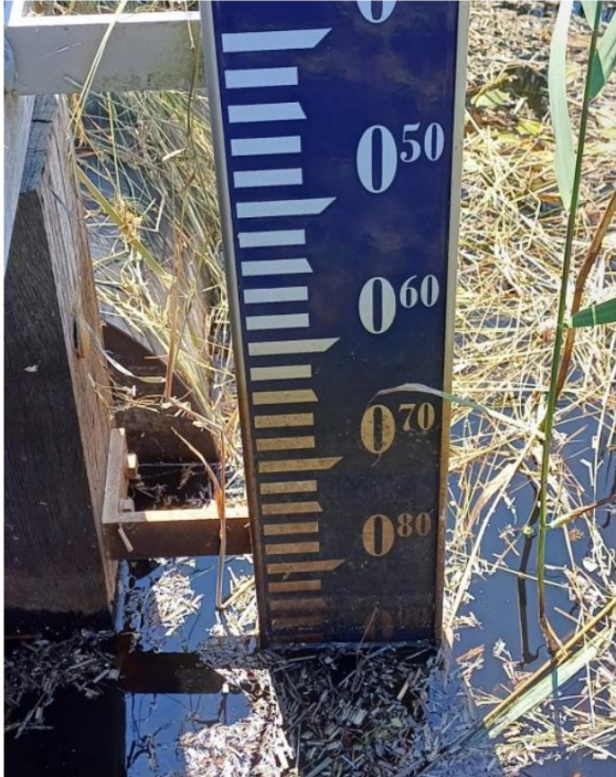
26 juni 2024. Peil Sefonsterpolder ca. -0,89 NAP.