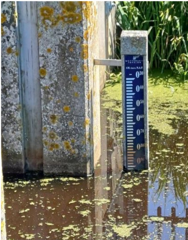
Gemaalpeil op 26 juni 2024 ca. -0,93 NAP.