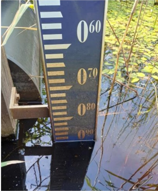
Peil stuwbak 31 juli 2024. Ca. -0,89 NAP. Peil even hoog als ingestelde stuwbereik