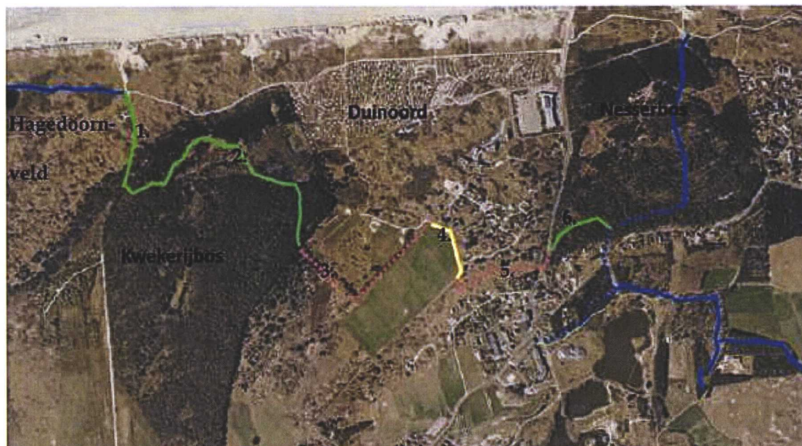
Ligging nieuwe ruiterroute