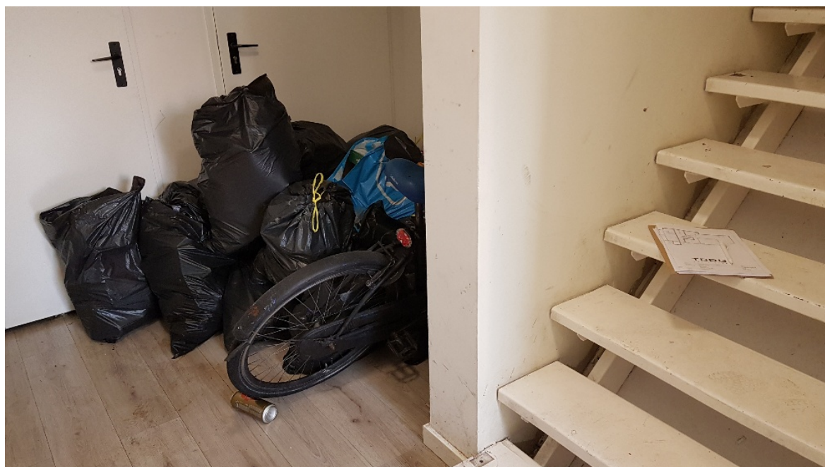
Foto 7 Centrale hal op begane grond