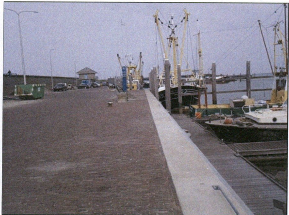
Foto 3 - Schadedetail