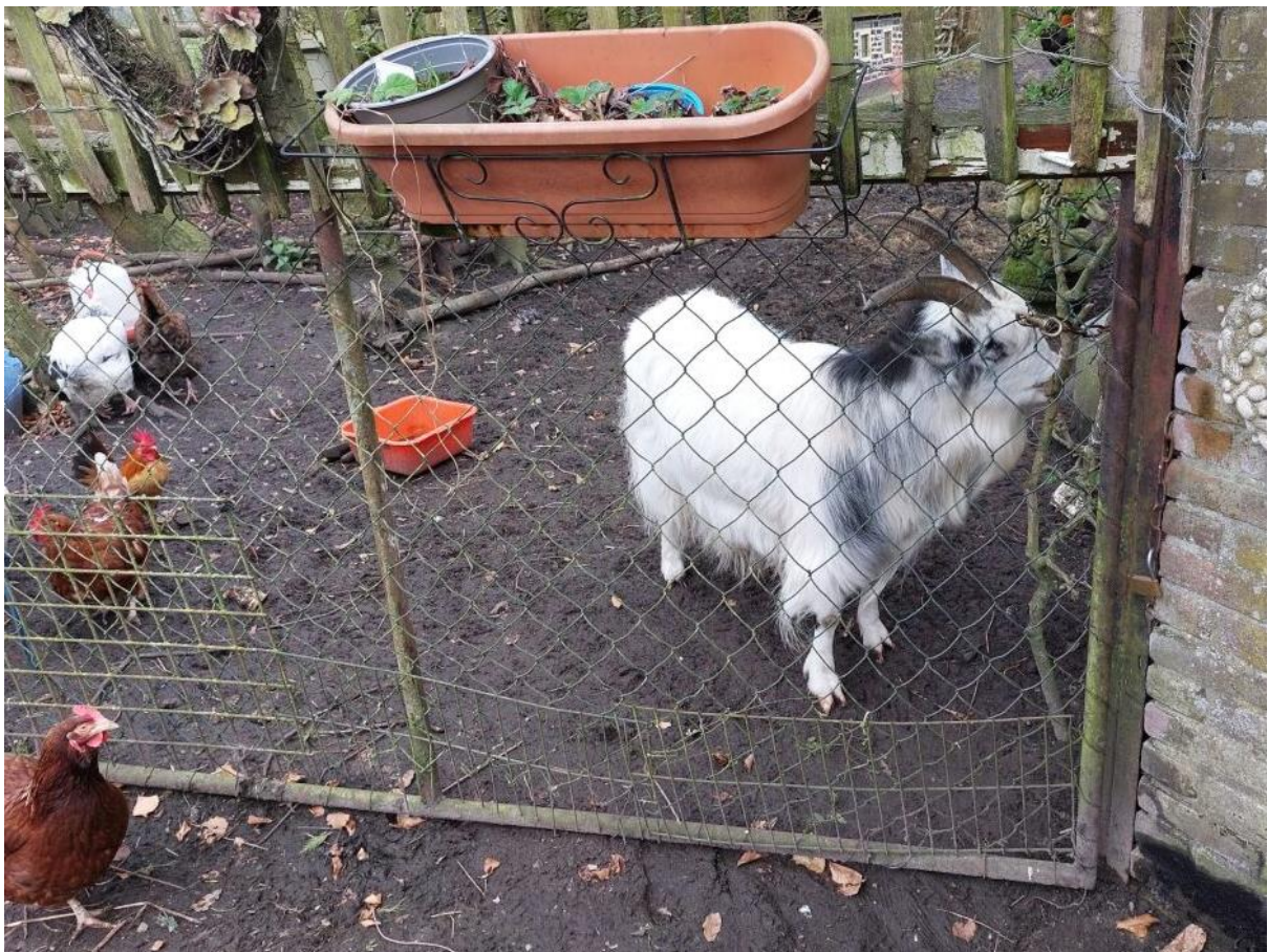
Figuur 5. Diverse dieren aanwezig op het terrein.