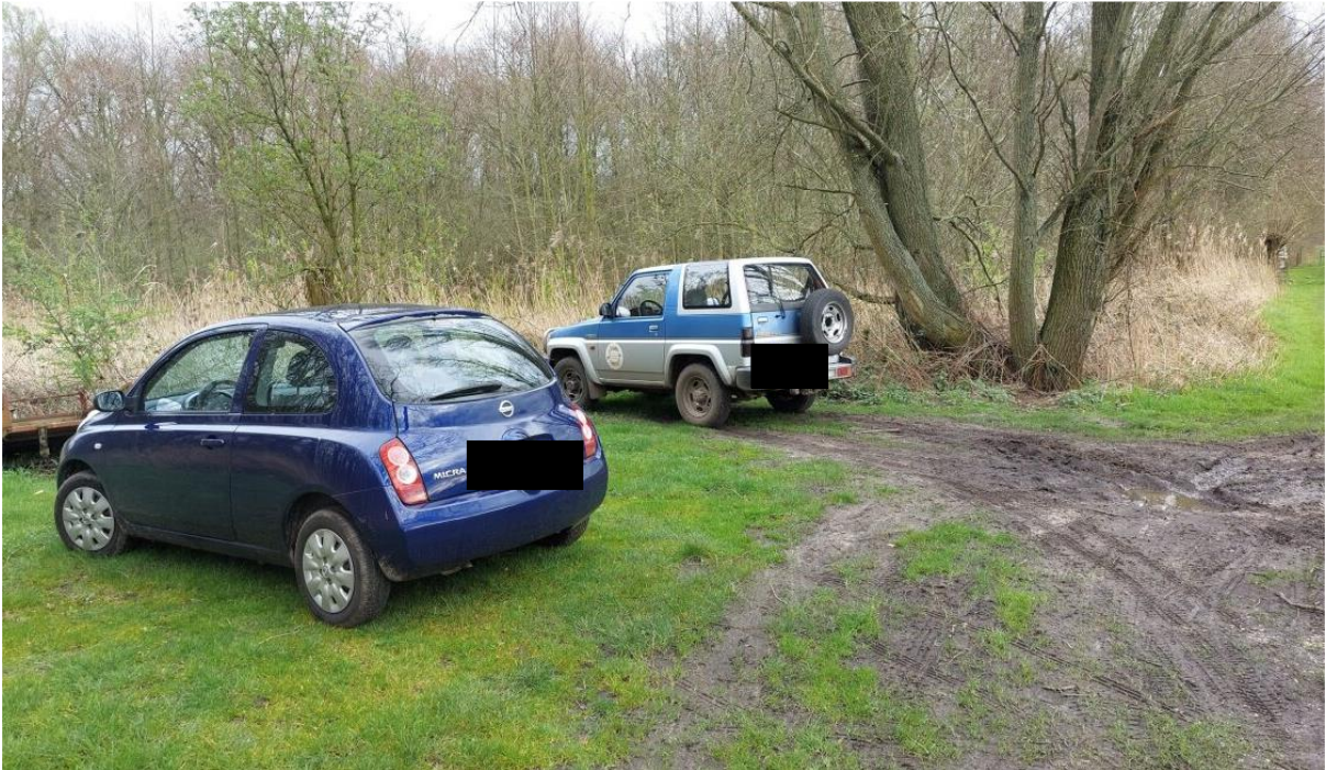
Figuur 1. Voertuigen van mevrouw en bezoekers geparkeerd aan de voorzijde van het perceel.