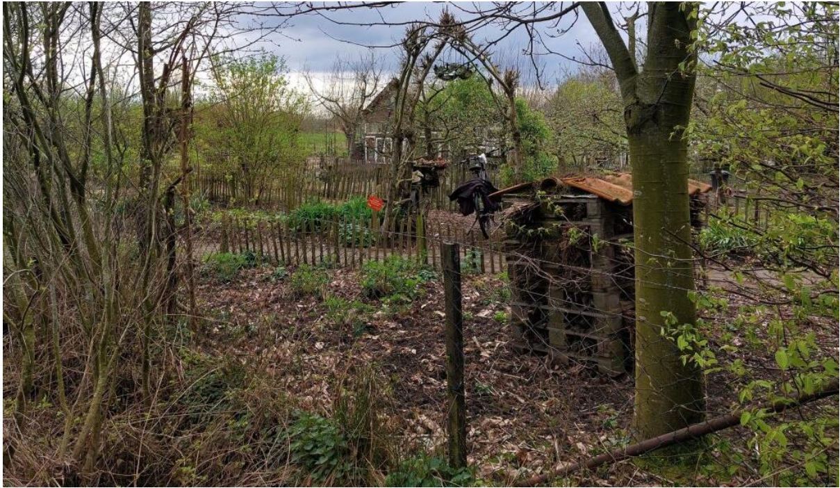
Figuur 4. Zicht op het terrein aan de voorzijde.