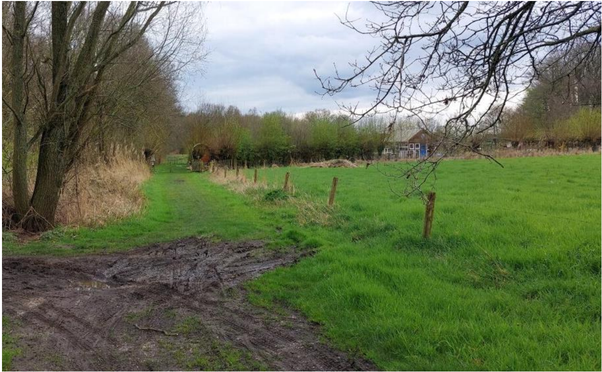
Figuur 2. Zicht op de locatie van het verborgen paradijs.