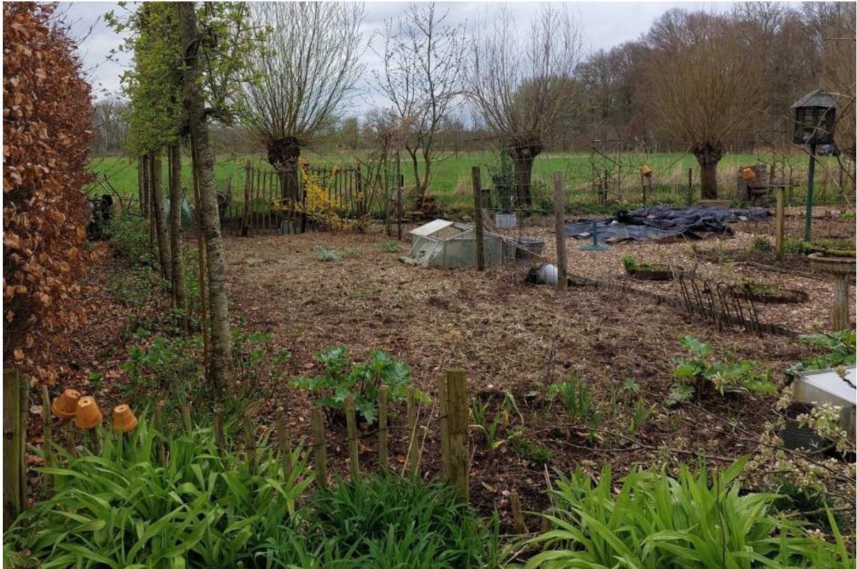
Figuur 6. Hier is het tuinhuisje dat gebruikt werd voor gereedschap verwijderd.