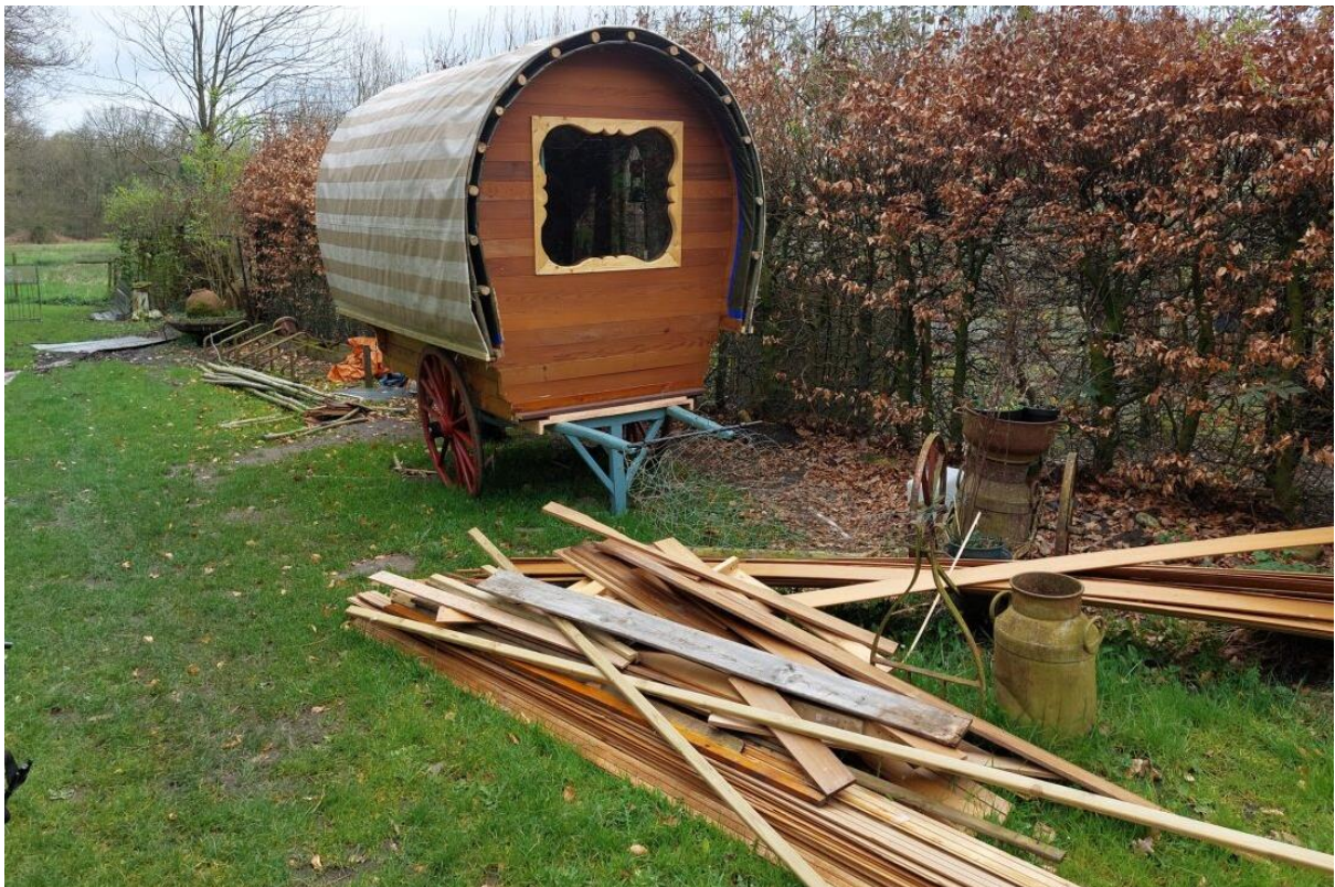
Figuur 3. Activiteiten bij de entree van het verborgen paradijs.