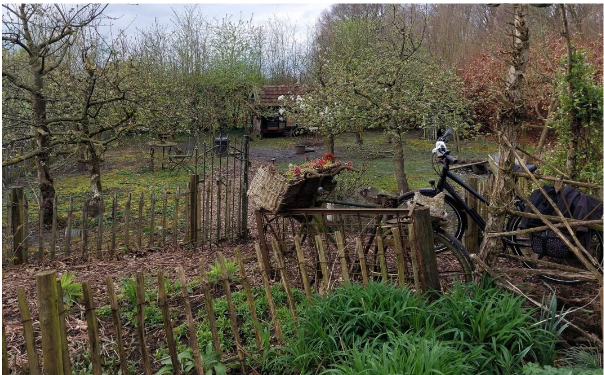
Figuur 9. Bouwwerk nog aanwezig, fruitbomen zijn gesnoeid.