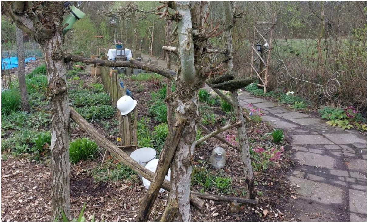
Figuur 8. Situatie ongewijzigd.