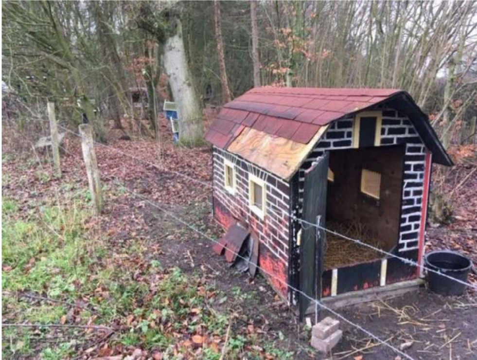
1) aanwezigheid van geitenhok (geit loopt ook in ons natuurterrein)