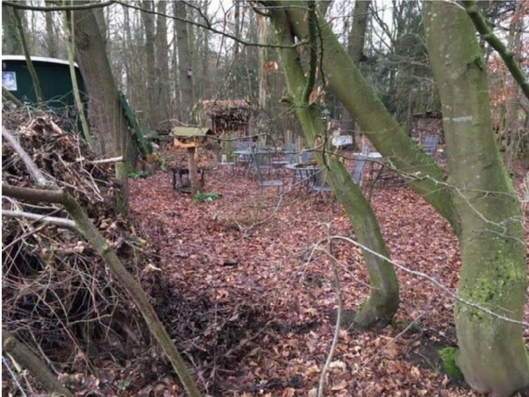
3) aanwezigheid van groene 'pipowagen', meerdere terras-setjes (stoelen, tafels), vogelhokjes, houthokjes, niet natuurlijke elementen/ornamenten, bloempotten, waardevolle ondergoei bos weggehaald