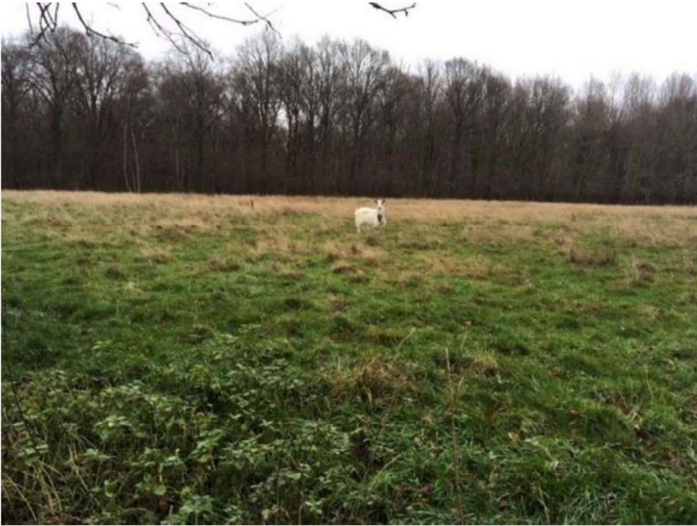
5) loslopende geit die in onze natuur loopt.