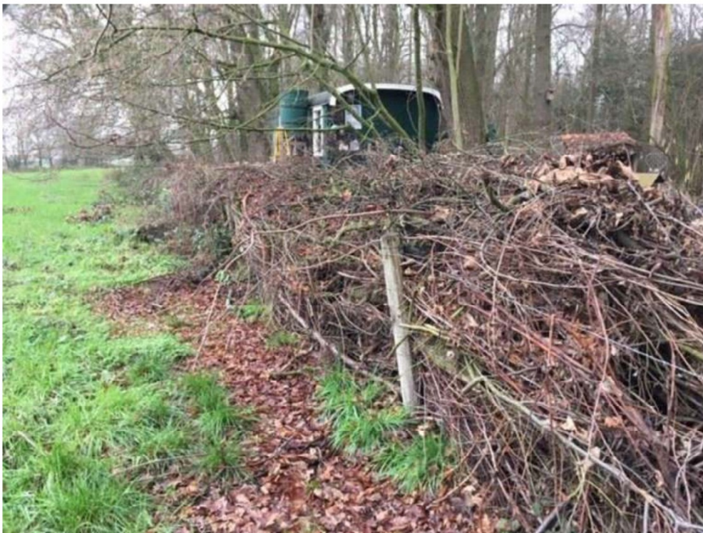
4) groene 'pipowagen', met takkenril leunend op onze vee afrastering