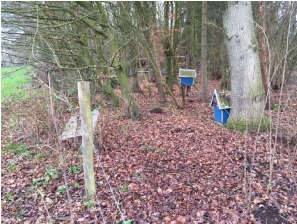
2) aanwezigheid van (dieren)hokjes, ondergroei bos weggehaald