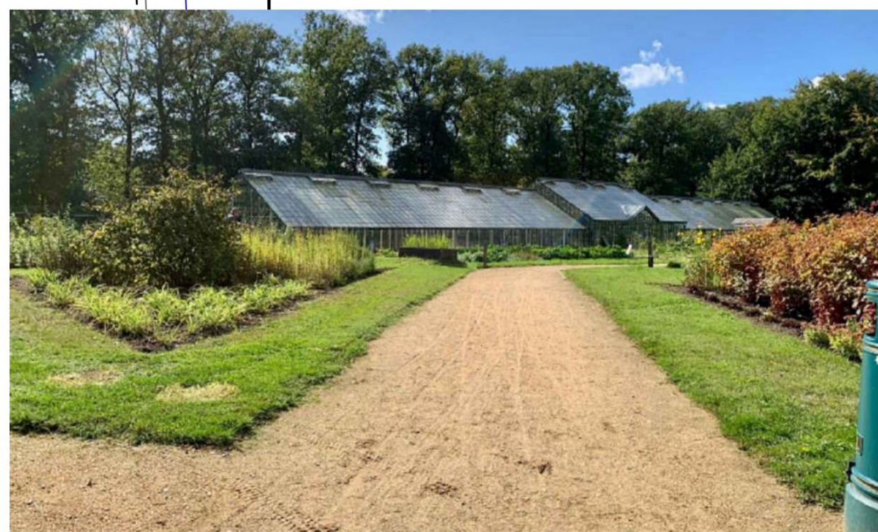
Afb. 2 - referentie halfverharding rondom woning