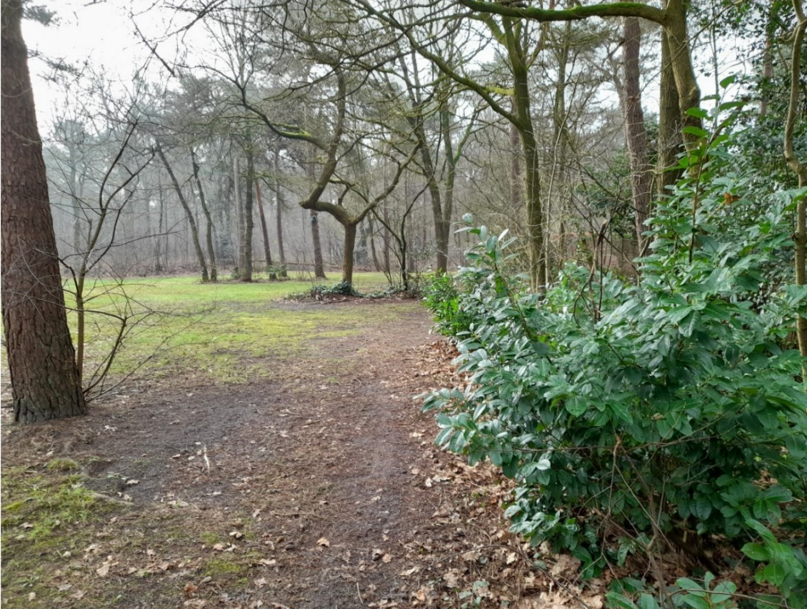
Overzicht van het westelijke deel van de uitbreidingslocatie, gezien in zuidelijke richting. Met aan de rechterkant de grens van het vakantiepark.