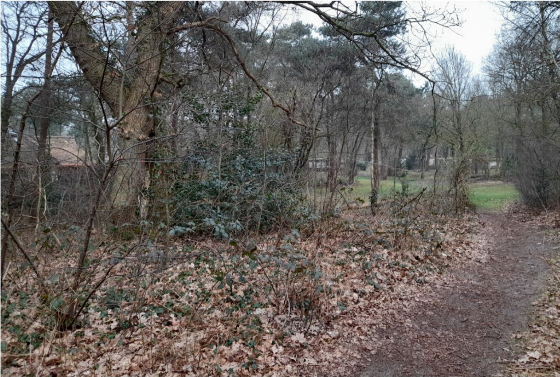
Zuidelijke grens van uitbreidingslocatie gezien vanuit het bosgebied, in noordelijke richting.