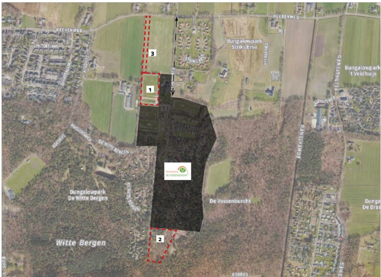
Figuur 1. Voorgenomen planontwikkeling met in donkere vlak: herontwikkeling en extensivering vakantiepark, locatie 1: parkeerterrein, locatie 2: beoogde uitbreiding vakantiepark en locatie 3: compensatielocatie vanwege verlies bosoppervlak (De Erfontwikkelaar, 2024).

De ambitie is een groen natuurlijk vakantiepark te creëren met voorzieningen voor jong en oud. De eigenaar zet zich in om bestaande bomen zoveel mogelijk te behouden en binnen vijf jaar de natuurwaarden te verhogen door gebiedsvreemde beplanting en exoten te vervangen door streekeigen beplanting. Dit gebeurt door toepassing van staalkaarten voor hagen, struweel en bomen (De Erfontwikkelaar, 2024). In bijlage 1 is een overzichtskaart met de toekomstvisie weergegeven.