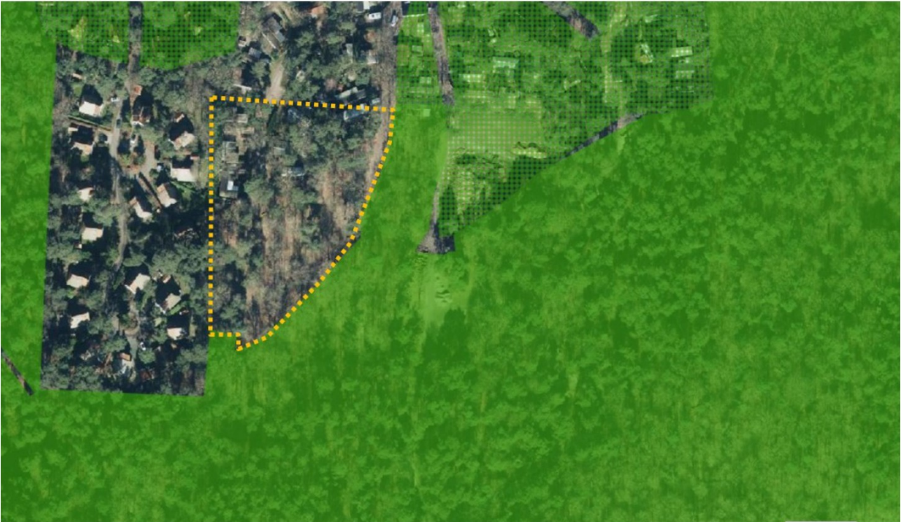
Figuur 2. Beoogd uitbreidingsdeel (oranje omlijnd) ten opzichte van NNN (groen vlak) en ZONW (groene arcering).

Ten aanzien van aangewezen ‘Natuur buiten het NNN’ blijven de conclusies uit de quickscan gelijk. Het recreatiepark ligt niet binnen overige ‘bos en natuurgebied buiten het NNN’ en weidevogelleefgebied. Wel ligt het binnen aangewezen agrarisch leefgebied ‘Droge dooradering. Hier wordt in de (plan)uitvoering rekening mee gehouden door nadrukkelijk de koppeling te maken met het KGO-beleid binnen de provincie Overijssel.