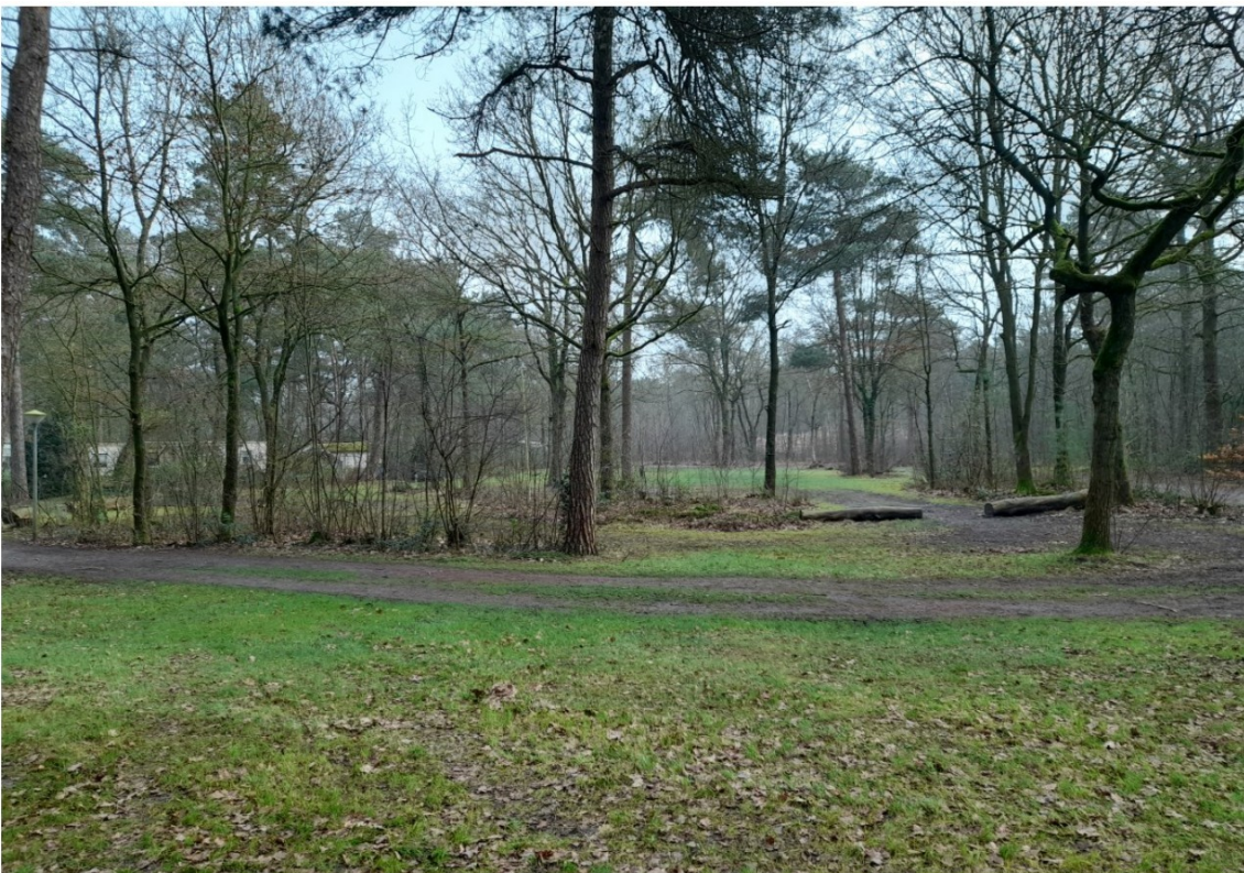
Overzicht van het oostelijke deel van de uitbreidingslocatie, gezien in noordelijke richting.