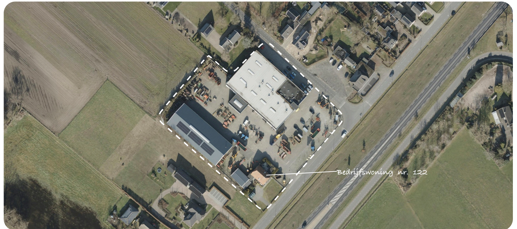
Afbeelding 2 Luchtfoto projectgebied