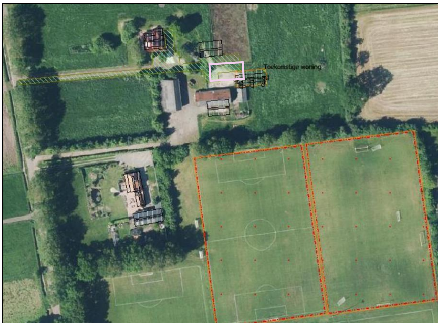
Afbeelding 1 Ligging nieuwe woning ten opzichte van voetbalvelden

Op het terrein aan de 2 e Lageveldsweg 10 te Wierden bestaat het voornemen om de gebouwen op het erf te slopen en daarvoor een nieuwe woning met bijgebouw te realiseren. De nieuwe woning wordt gerealiseerd middels een wijziging van het omgevingsplan. De nieuwe woning bevindt zich op korte afstand van de voetbalvelden van de voetbalvereniging SVZW.