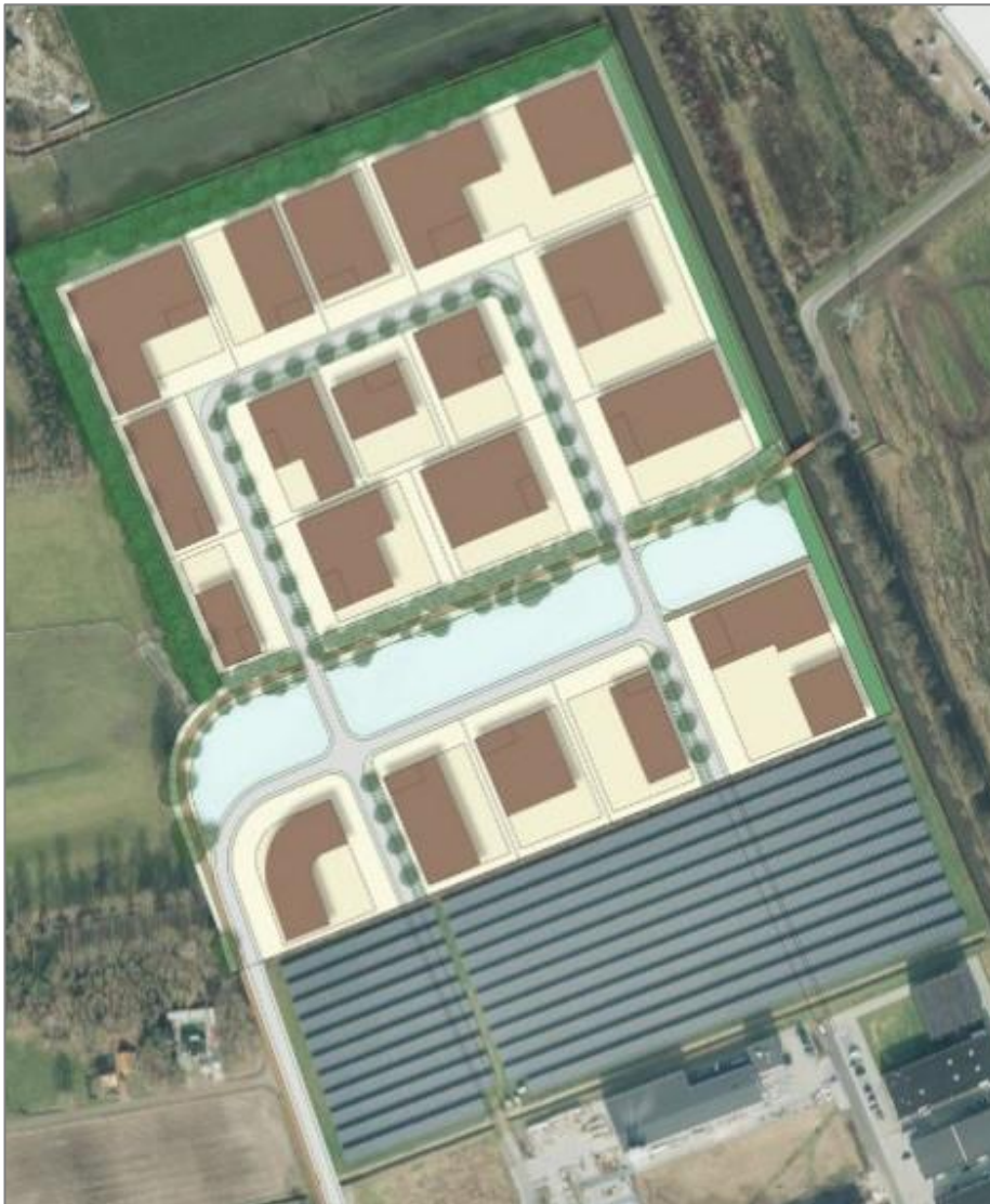
Figuur 1. Toekomstige indeling planlocatie

Men is voornemens het bedrijventerrein Weuste Noord, gelegen in Wierden, uit te breiden. Figuur 1 toont de toekomstige indeling van de planlocatie.