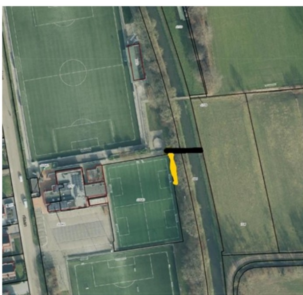
Nieuwe locatie loopbrug = verlengde van voetpad