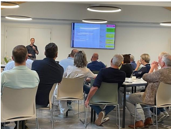
Foto: Bijeenkomst in Enter juli 2025

In het proces zijn op twee verschillende momenten inloop- en informatiebijeenkomsten georganiseerd. Tijdens de eerste sessie informatiebijeenkomsten in het voorjaar van 2024 werd mensen gevraagd om mee te denken over oplossingen voor (maatschappelijke) problemen. Tijdens bijeenkomsten in juni/ juli 2025 werd mensen gevraagd of ze zich herkenden in de conceptvisie en de oplossingen die zijn opgenomen voor maatschappelijke opgaven. Tijdens de bijeenkomsten werd veel informatie uitgewisseld. Het aantal mensen dat aanwezig was bij een bijeenkomst liep uiteen.