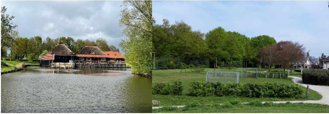
Foto's ingestuurd door jongeren met mooie plekken in Enter en Wierden